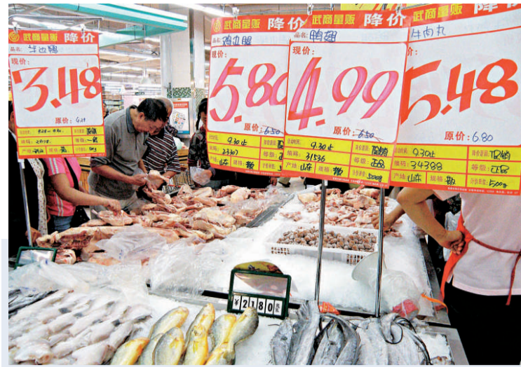
易網認為，內地今年CPI仍會出現負增長

【本報記者羅紫韻報導】中國人民銀行副行長、國家外匯管理局局長易綱表示，由於去年四季度物價處於低谷，今年四季度CPI（居民消費價格指數）同比將肯定為正；但由於前三季度CPI負增長比較多，全年CPI還可能是比較小幅度的負增長。全國政協經濟委員會副主任、知名經濟學家厲以寧亦認為，中國暫不會出現通貨膨脹，而適度寬鬆的貨幣政策還不能改變，至少要到明年全國人大、政協「兩會」期間。