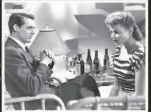
▲《美人計》以男女攻防戰為主軸