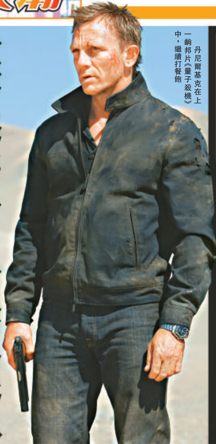
一齣邦片《量子殺機》中，繼續打餐飽