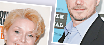
▲夏傑斯炮轟科學教派處事方式