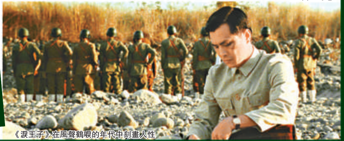
《淚王子》在風聲鶴唳的年代中刻畫人性