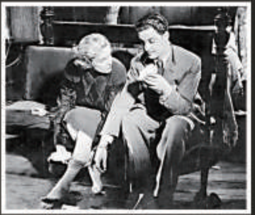
▲《39階梯》為希治閣的作品