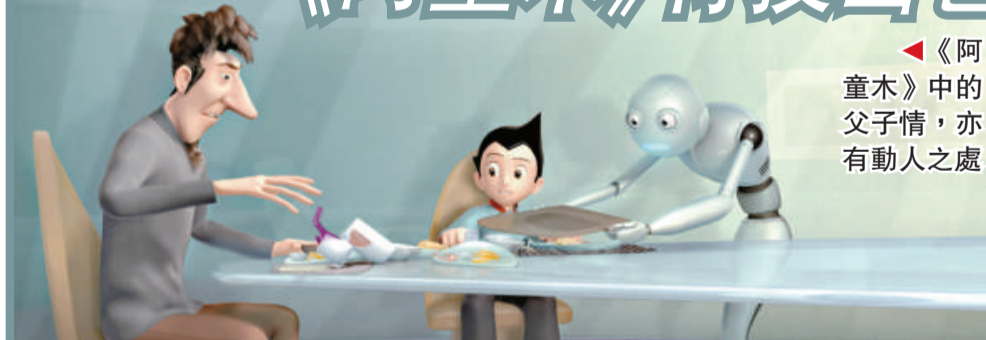
◀《阿童木》中的父子情，亦有動人之處

《阿童木》上映，筆者在此呼籲大家都購票進場，以示支持。因這齣花費八千萬美元，相等於六點二億港元的製作，是香港四百名動畫人員經年炮製的成果，是百分之百的香港製造，身為香港人怎可以不捧場，而且期望它比《忍者龜》更叫好叫座，為本港的創意工業注下一枝強心針。