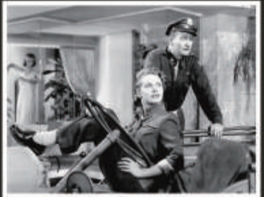
▲尊榮(右)在《Jet Pilot》中飾演美國空戰英雄

間諜在西方電影中出現最多的造型，無疑是猶如超人般的007占士邦電影。持續三十多年的冒險中，占士邦在像主題公園般的世界中闖蕩，間或會遇上局面複雜的鬥智場面，不過更多是風花雪月、遊山玩水的場面，很難想像這是來自一位真正間諜寫的原著小說。當然，占士邦小說的原著作者易安佛萊明(Ian Fleming)做間諜的時代是二次大戰，他策劃的行動大多是大膽的突襲，例如登上德國潛艇搶他們的密碼機之類(只是可恨的荷里活電影把這件事拍成美國佬的功勞)，和冷戰時期的東西對峙的微妙無關。不過，當占士邦電影的反派不是魔鬼黨之類的秘密組織或狂人，而是前蘇聯情報機關時，諜戰對抗描寫的確是多了幾分實感。