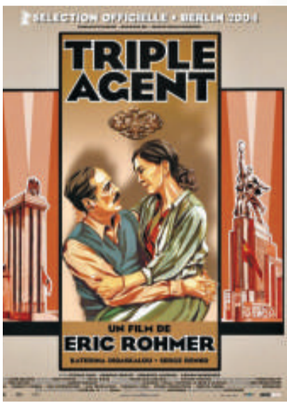
▲伊力盧馬的《三重間諜》，劇情曲折

其實，間諜電影早在占士邦前已經拍成行成市，默片時代的德國電影大師費滋朗，在一九二八年就拍過一部名為《The Spy》的電影，當中的間諜鬥爭涉及德日蘇等多方勢力，亦有汽車追逐，火車打鬥等大場面，可算是占士邦類型的先驅。不過，拍間諜片最多的電影大師還是數希治閣(Alfred Hitchcock)，由英國時代的《39階梯》(The 39 Steps)、到《美人計》(Notorious)、《北西北》(North By Northwest)，無不充滿了諜戰的背景，對手有時身份不明，有時則是納粹德國。我們今天叫希治閣做驚悚大師，但不要忘记，間諜題材正正是驚悚片的一個類型。