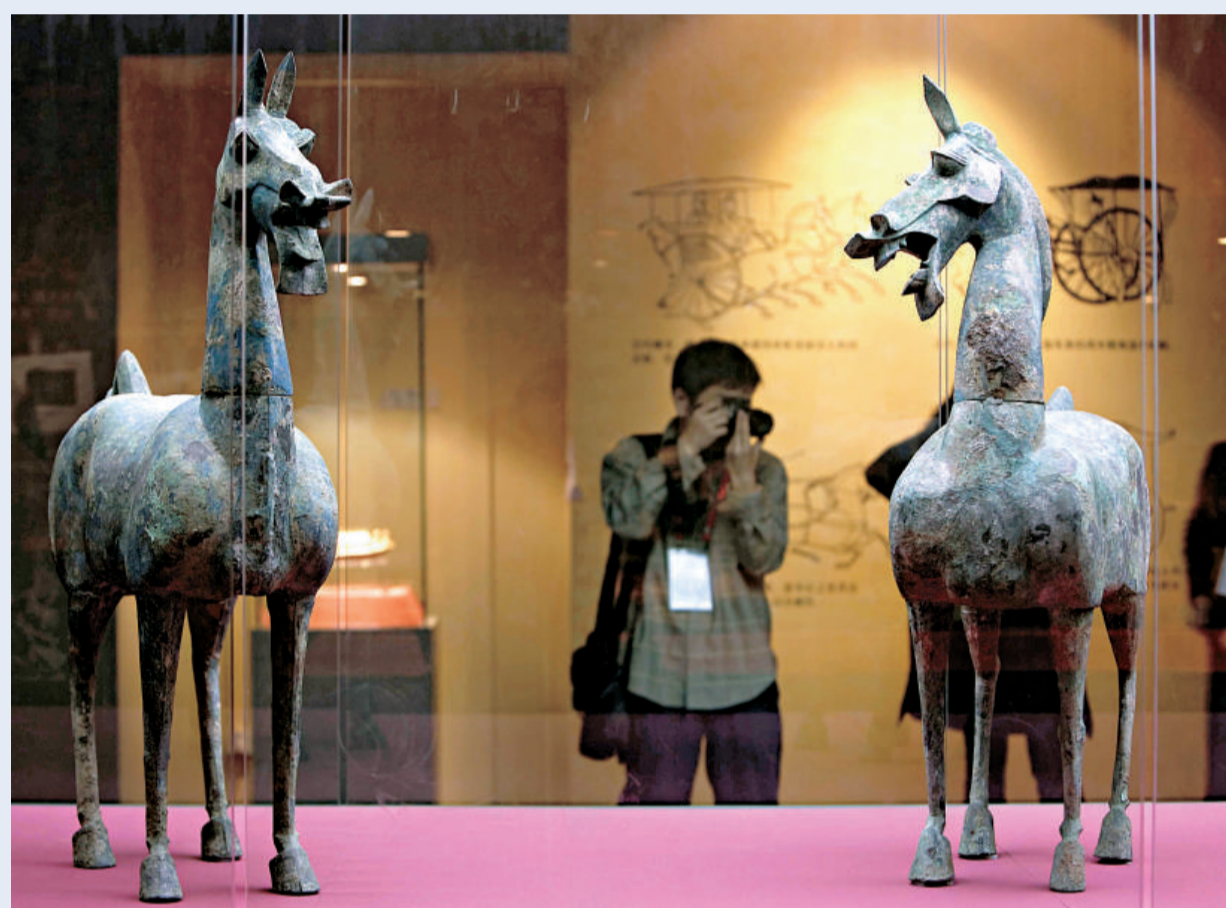
世界文物聚洛陽 河南省洛陽市將於本週末迎來大遺址保護洛陽高峰論壇。屆時，《秦漢—羅馬文明展》、《大遺址保護成果展》、《中國古代都城文明展》、《洛陽珍寶展》等四個精彩專題展覽也將同步開幕。圖為《秦漢—羅馬文明展》27日舉行媒體開放日，展出的各文物珍品提前亮相。