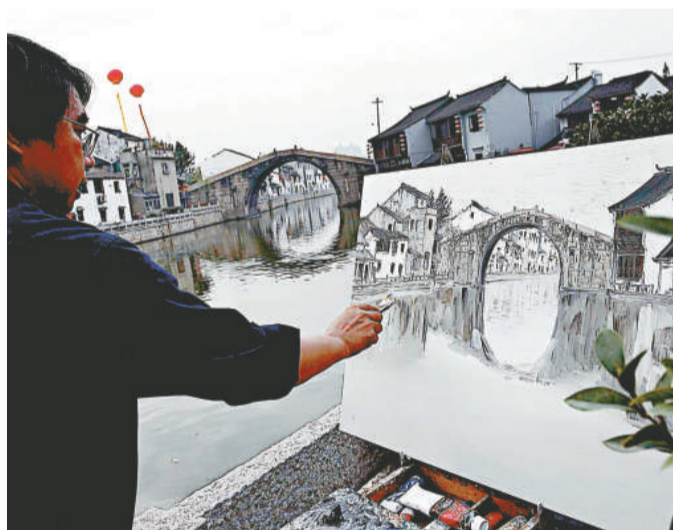
中國大運河文化遺產保護無錫峰會27日在無錫舉行。圖為一位來自廣西的畫家在無錫古運河畔寫生。

董明康認為，在現行的管理體制下，需要進一步明確各方職責，做到各司其職，各盡其責，避免出現管理越位或缺位。目前《大運河保護管理條例》制訂工作已經取得實質性進展，基本框架內容均已確定，這是大運河保護和申遺的一個重要步驟。