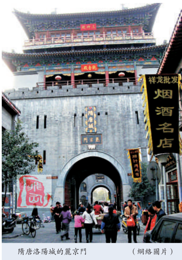
隋唐洛陽城的麗京門

為進一步擴大隋唐洛陽城宮城核心區保護展示規模，洛陽市委、市政府近期決定斥資十億元，整體搬遷洛玻集團，徹底解決不合理佔壓隋唐洛陽城宮城核心區的問題，使九洲池遺址群等重要文物遺跡得到有效保護。