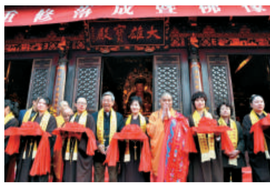
大雄寶殿落成的剪綵儀式