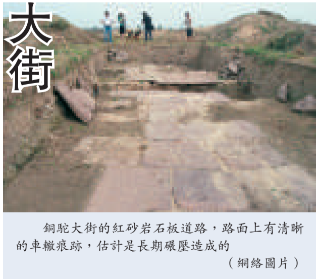
銅駝大街的紅砂岩石板道路，路面上有清晰的車轍痕跡，估計是長期碾壓造成的 (網絡圖片)