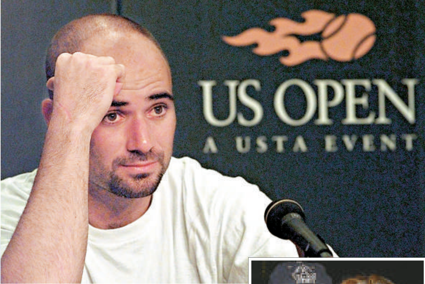
▶阿加斯在1997年美國網球公開賽輸掉比賽後接受記者提問（資料圖片）

阿加斯的自傳於二十八日和二十九日在《泰晤士報》獨家連載。《人物》和《體育畫刊》兩本雜誌本周也將刊登阿加斯自傳摘要。