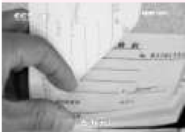
教師的捐款收據 (視頻截屏)

河北威縣新近公開招聘500多名高校畢業生，最後擇優錄用了191位，充實到全縣中小學的教學一線。但讓這批懷揣教師夢想的莘莘學子始料不及的是，上班不足1個月卻遭遇了「被捐助」事件。威縣教育局要求，專科畢業生捐5萬元，本科畢業生捐3萬元，名目是「捐資助教」，違者將被開除。學校還威脅教師，如果上訪會被除名。