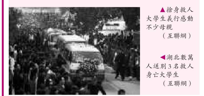
▲捨身救人 大學生義行感動 不少母親