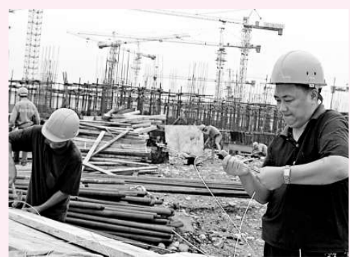
北川新縣城自今年正式開工以來進展順利

縣的政治、經濟、文化中心，川西旅遊服務基地，綿陽西部產業基地和現代化的羌族文化城。