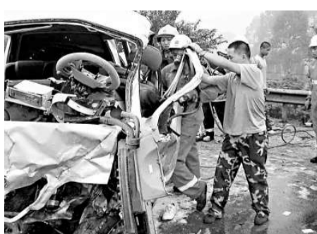
救護人員在現場施救

二十八日早上，廣安廣安區發生一起兩車相撞的交通事故，造成四人當場死亡，四人重傷。事發於廣安市三零四省道一百一十三公里加五百米處(當地人稱「觀塘女店子」)，一輛三菱越野車從廣安市往廣安區前鋒鎮方向行駛，在超越一輛客車時與一輛迎面駛向廣安的載人長安汽車相撞。目前，事故原因正在調查中。(中新社)