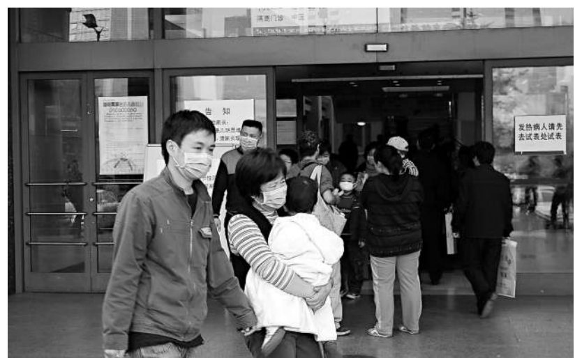
北京兒童醫院門診部門口，病人和家屬都戴上口罩

10月22日，北京航空航天大學3000餘名2009級新生赴大興高教軍訓基地開展軍訓期間，部分學生中陸續出現發熱等甲型H1N1流感樣症狀。10月26日，一名新生因病發展送往區醫院救治，經全力搶救無效於27日死亡。接報後，北京市衛生、教育部門立即督促並協調北京航空航天大學進一步採取隔離、防控措施。其中，體溫超過38℃的71名學生已有28名咽拭子檢測甲型H1N1流感病毒核酸陽性。目前，患者病情基本穩定，生命體徵平穩，無危重病人。