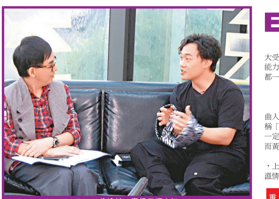
Eason 收泳褲，覺得尺碼太細