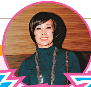
劉曉慶看來年輕不少，回春真有辦法