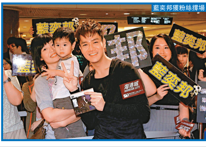
藍奕邦獲粉絲擁護

藍奕邦前晚出席《藍奕邦 (邦) 簽唱會@海港城》簽唱會，歌迷反應熱烈。阿邦以一身黑色型格造型出現。為了加強阿邦最新主打歌《向前走》歌曲的正面訊息，簽名會上，大會亦宣布較早前於海港城的 facebook 版面內，進行了藍奕邦 x 海港城「放下……然後向前走」前事回收行動，阿邦更更席呼響各位將自己過去一些一直放不下的人、事、物件，以 400 字去記下，並連同該物件之相片於 11 月 1 日前電郵至 harharcitizen@gmail.com。而被選出為最感人的兩個故事及阿邦最喜愛的一個故事的得獎者將會得到《藍奕邦 (88+1) 音樂會》門票兩張及完騷後更可到後台探阿邦班。