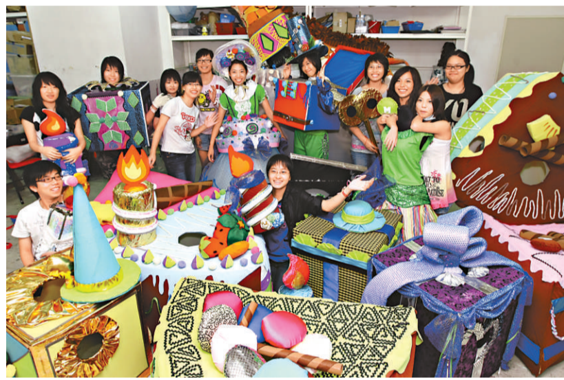
▲青少年與藝術家在工作坊內製作巡遊作品

及由學生及藝術家製作八至十二呎高的長頸鹿、樹精靈、太陽神、大象及魔術師等八個巨型木偶，在維園草地上不停輪流演出。為讓市民能共同創作出充滿藝術氣息的作品，現場亦特設免費藝術攤位，讓大眾親手創作巡遊隊伍所穿戴的瘋狂帽子、誇張飾物及小型撐杆偶等，一同感受藝術的瘋狂魅力。