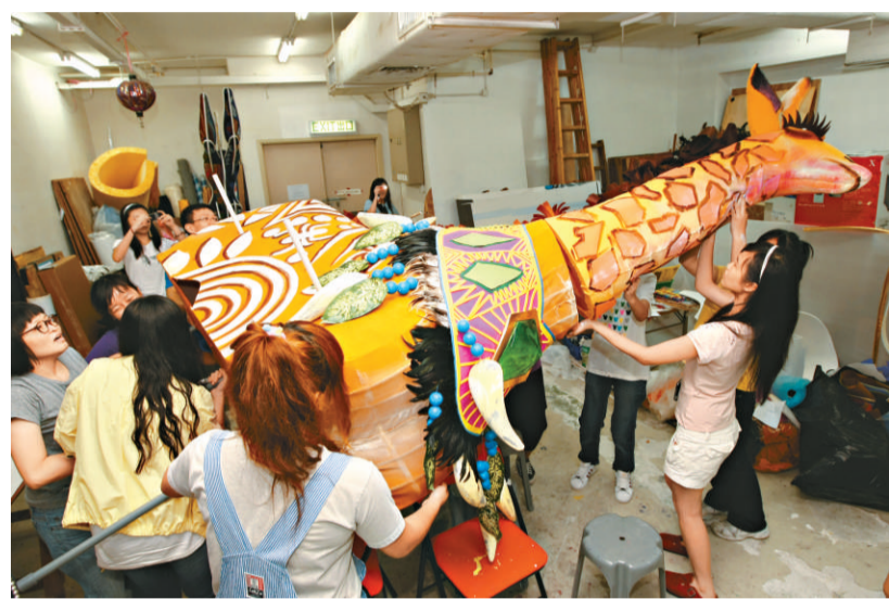
▲學生製作巨型長頸鹿

來自九十七間中、小學逾五百位青少年，將於十一月十五日下午三時半開始，以大型木偶巡遊匯演的方式，向市民大眾展示他們的作品。除了大型主題巡遊，同場還會展出來自四十五間本地學校，逾二千名學生共同製作的五百支大型彩繪絲印旗幟，以