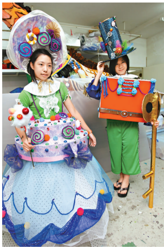
▲學生設計充滿節日氣氛的誇張服飾

非洲的賴索托人常在慶祝活動內，以唱歌形式祝願「和平、雨水、豐盛年」。遇上旱災，他們會舉行求雨儀式，女士會參與「拔河角力」的習俗，而男士會連群搜獵、高唱戰歌