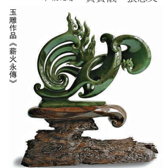
玉雕作品《薪火永傳》