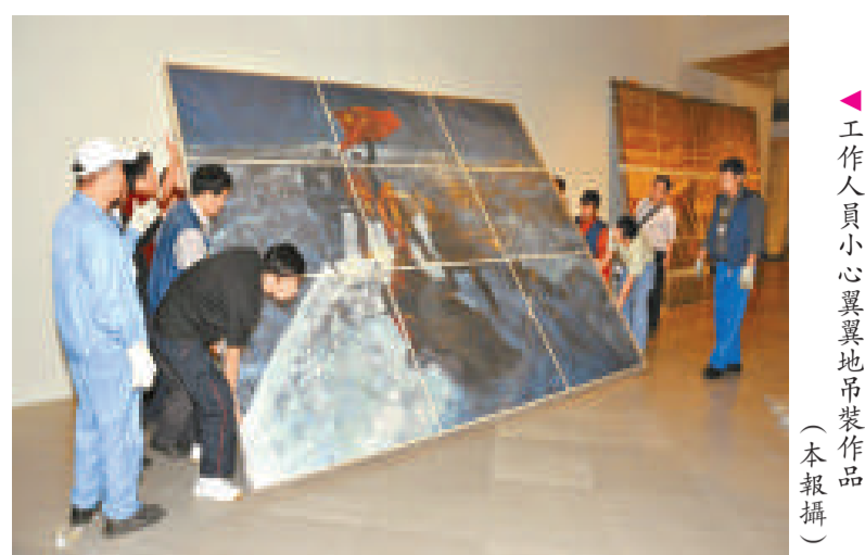
▲工作人員小心翼翼地吊裝作品