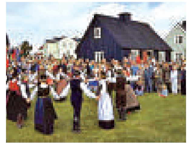
冰島居民舉行傳統儀式。冰島是世界上男女最平等的國家（資料圖片）

扎西迪稱，該報告主要基於過去一到三年的數據。數據資料來源於國際勞工組織、世界衛生組織和聯合國開發計劃署。