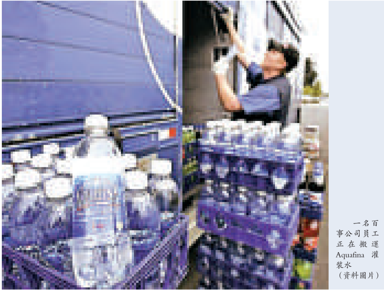
一名百事公司員工正在搬運 Aquafina 樽裝水（資料圖片）

Inc. 和 Carolina Canners 達成一項秘密協議，生產一種名叫「U.P.」的新飲品。不過，該兩家公司的高層人員違反協議，並把那種飲品的資料交給百事公司。十多年後，百事推出一款名叫 Aquafina 的樽裝水飲品，他們聲稱是妙襲「U.P.」的概念。