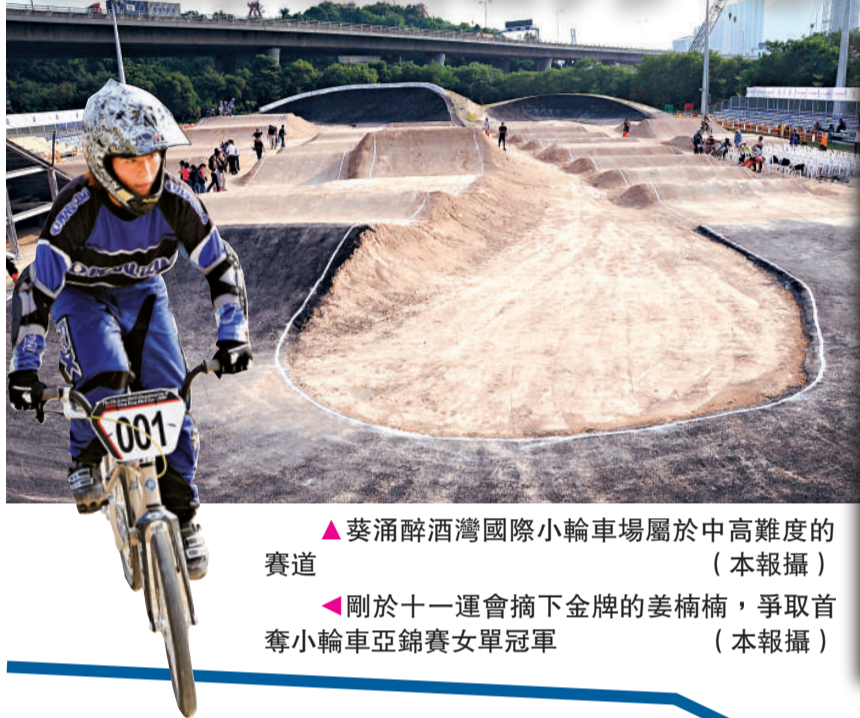
▲葵涌酒灣國際小輪車場屬於中高難度的賽道

今次是賽馬會國際小輪車場落成後首次承辦大型比賽，該場地亦是東亞運BMX賽事的比賽地點。港隊兩名代表及中國隊的成員對賽道大致感到滿意，但他們都認為部分坡道有改善設計的空間。除了第4屆亞錦賽外，明日亦會在同一場地舉行香港小輪車公開賽，多名國際級職業選手將會參與角逐。賽事不設門票，觀眾可前往葵涌酒灣欣賞今明兩日的比賽。