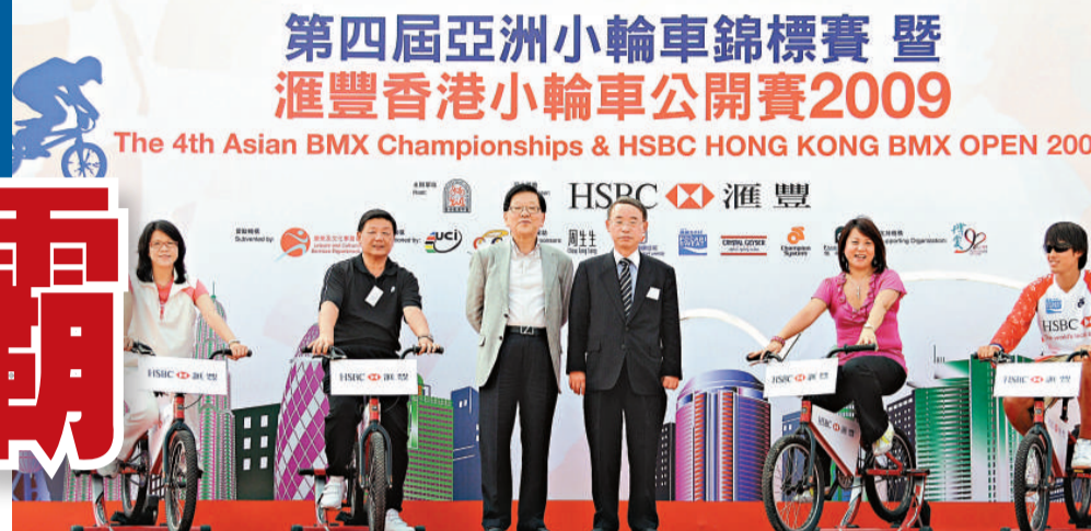
▲國際單車聯會副會長曹喜旭（右三）主持啓動儀式