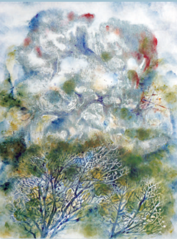
▲岩·樹（凸版及平版） 鍾永文