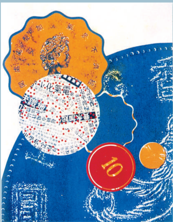
▲裂變（珍珠版凸版畫） 霍爾德