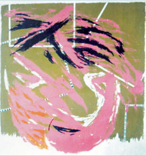
▲肖像（絲綢版畫） 鄧榮之