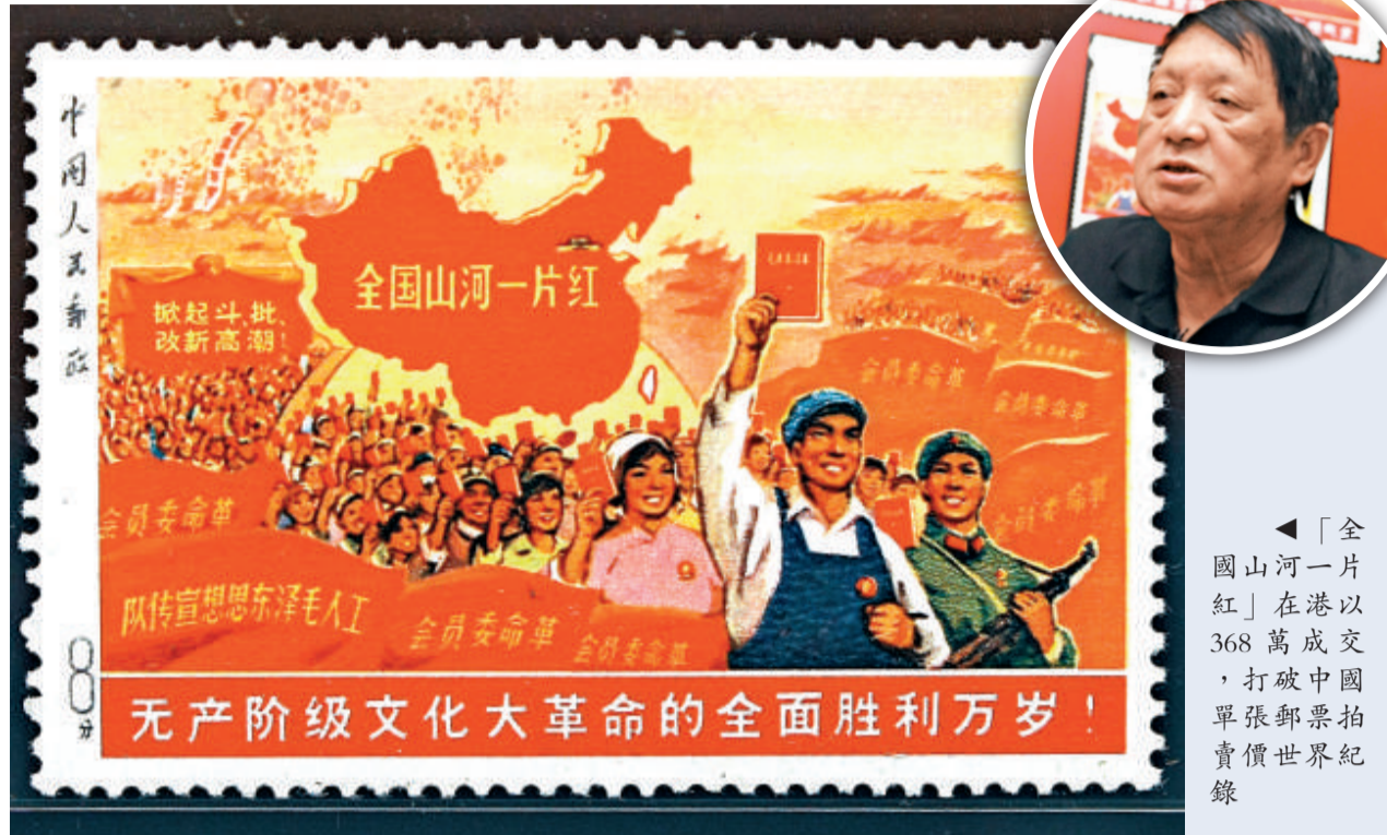
「全國山河一片紅」在港以 368 萬成交，打破中國單張郵票拍賣價世界紀錄。

郵電部急令全國各地郵局停售並要求全數收回，僅有少量郵票流入市面。對於當年這個眾說紛紜的「重大錯誤」，年屆八十的郵票設計者萬維生昨日在香港道出了其中的緣由，他回憶說，「全國山河一片紅」確實存在錯誤，如世人所猜，錯誤源自那幅地圖，但並非來自沒有塗成紅色的台灣。