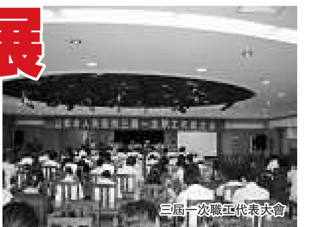
三屆一次職工代表大會

接受群眾的諮詢和監督，不搞院長個人說了算。這樣既堵塞了漏洞，防止不正之風的發生，同時又使職工代表在醫院的民主管理中真正做到有位、有為、有效，形成上下一致、齊抓共管的管理合力。該院新建落成的 23 層病房大樓建設工程是全職職工及當地百姓關注的焦點，為實現科學管理，確保工程透明度，醫院從病房大樓建設之初就成立了工程建設監督小組，專門聘請市紀委、市監察局、市檢察院和局紀委有關領導同志為監督員，對工程建設的全過程進行監督指導。病房大樓從工程設計、施工，到病床、醫療器械等大宗物資的採購供應等均嚴格執行招投標制度，共舉行公開招標 20 餘次，每次均隨機抽取職工代表進入評標小組，給職工以充分的「話語權」，工程建設監督小組全程監督。本着公開、透明、公正的原則，以價格、質量的最優組合，通過當場投票的方法決定中標單位，杜絕了工程建設中不良行為的發生。病房大樓最終成了名副其實的「陽光工程」、「廉政工程」。三是為進一步發揮廣大職工在民主建院、民主管理中的積極作用，該院堅持運用院報、宣傳欄、現代化的網站、院長信箱、OA、論壇等多種載體與職工和社會各界進行多方面的溝通交流，及時、真切地了解群眾的願望和呼聲。凡切實可行、有利於提高醫療服務質量、有利於醫院發展的意見和建議均迅速採納。網站建立以來，院領導還通過網