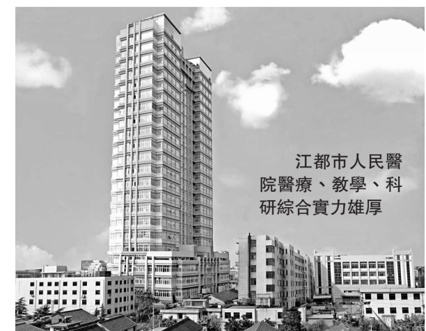
江都市人民醫院醫療、教學、科研綜合實力雄厚

站了解到很多在日常工作中難以得到的信息。原來，有些群眾不敢說、不願說的事，在網上，大家暢所欲言。如有的醫務人員對科室領導在工作中的做法有意見，擔心當面提了以後會被「穿小鞋」，通過網上提意見，院領導很快發現了問題，及時進行了妥善處理。四是努力拓寬民主評議渠道，推進醫院管理更加民主化、科學化。評到具體部門及個人工作的好壞，經常有業務聯繫科室的人員具體發言權。近年來，該院改變了以往單一從領導班子直觀和患者反饋信息兩個視角來評價科室及個人工作情況的做法，增加了同級關聯科室人員的評議，從而使評價更加準確和科學，進一步調動了廣大職工的工作積極性。