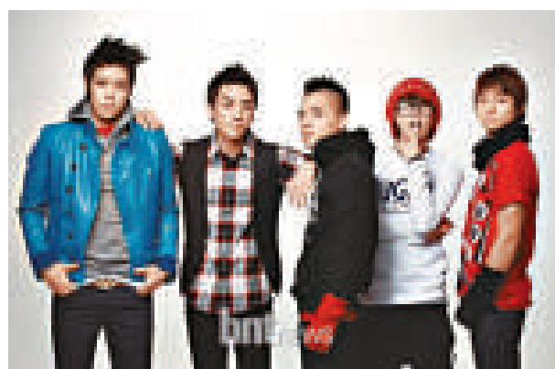
組合「Big Bang」被《時代》雜誌撰文讚賞的Rain後另「Big Bang」被譽為繼

曾和崔智友主演《連理枝》的趙瀚善，將於明年一月入伍前與比他小兩歲的女友結婚，至於婚禮日期和地點則稍後再作公布。趙瀚善的未婚妻為美術系研究生，性格文靜。趙瀚善早前剛拍完電影《加油！四條街》續集，電影預計在明年初上映，而趙瀚善屆時也會積極宣傳。