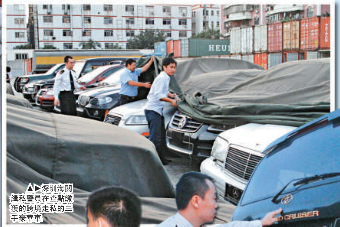
▲深圳海關緝私警員在查點繳獲的跨境走私的二手豪華車