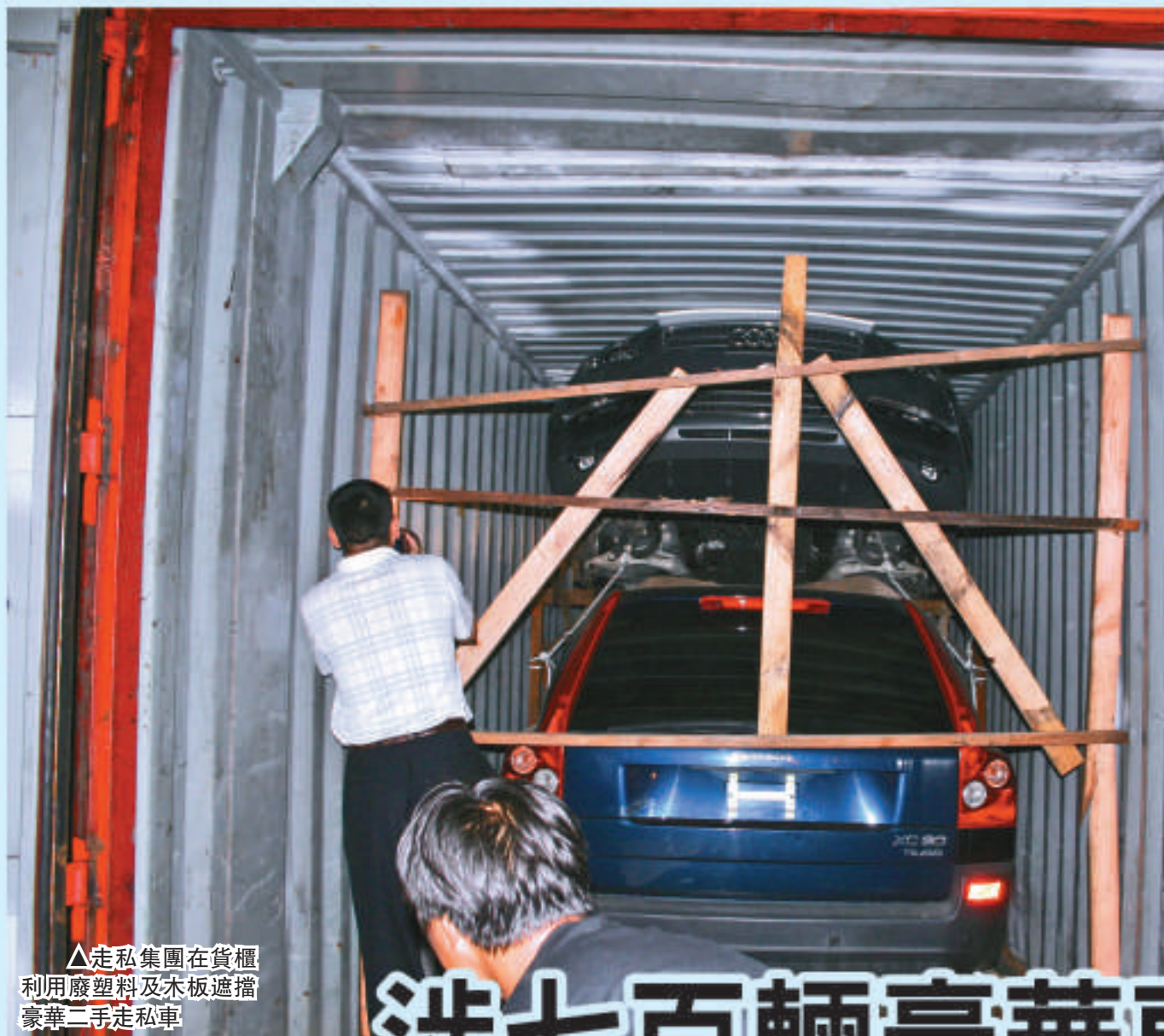
▲走私集團在貨櫃利用廢塑料及木板遮擋豪華二手走私車