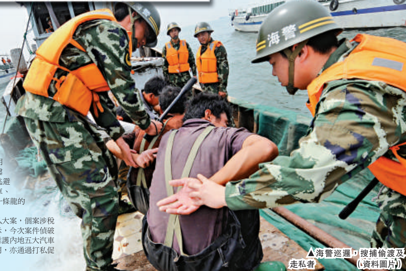
▲海警巡邏，搜捕偷渡及走私者（資料圖片）

今次海關總署掛牌督辦的跨境豪華汽車走私大案，個案涉稅款超過二億元人民幣。深圳海關緝私專案組表示，今次案件偵破，有效遏制了內地龐大的豪華二手車走私，對維護內地五大汽車進口口岸正常的汽車貿易進口有直接的保障作用，亦通過打私促稅可回籠國家稅收。