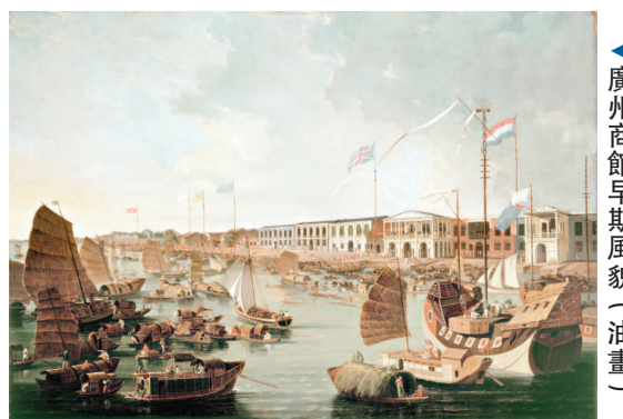
▲廣州商館早期風貌（油畫）