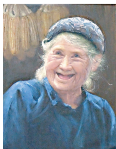
▲《好年景》（油畫）