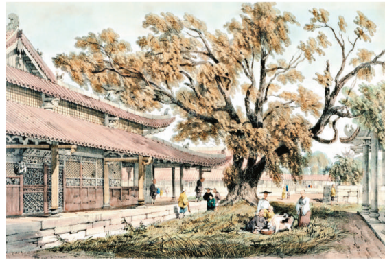
▲廣州河南海幢寺（設色石版畫）