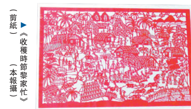
▲《收穫時節黎家忙》（剪紙）（本報攝）