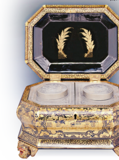
黑漆描金庭園人物圖茶葉盒（漆器）