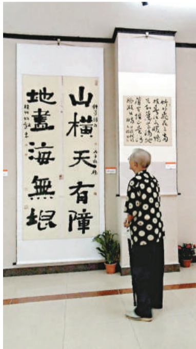
▲一位老書法家在作品前觀賞