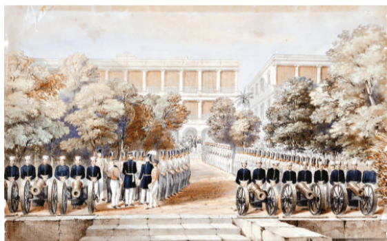
▲廣州英國商館前的士兵行列（設色石版畫） ▲飯席（水粉紙本）

在公在私，在廣州購物都是不可錯過的重要事項。到廣州公幹的洋人大都是進行出口貿易，最大的三種生意是茶葉、絲織品和瓷器，一般動輒以噸計成批採購。按清政府規定，三大貿易由行商代理，洋人通常不可直接與生產商交易。此外，各商館、海員及其他旅客均可在商館區的購物街選購各式廣東工藝、小批量茶葉、土產、酒食等，以便送禮自奉或回國轉售。整個商館區共有七十至一百間店，不少店舖會在門柱上加裝一片英文小招牌，標明店名或簡介一下貨品類型，讓旅客更好享受購物的樂趣。