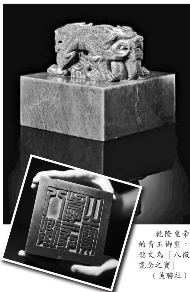
乾隆皇帝的青玉御璽，銘文為「八徵耄念之寶」

此外，2004年首都博物館曾斥730萬元從本港拍賣會購回兩件清朝文物，包括一枚「乾隆白玉鑲雕龍紐方形璽」。