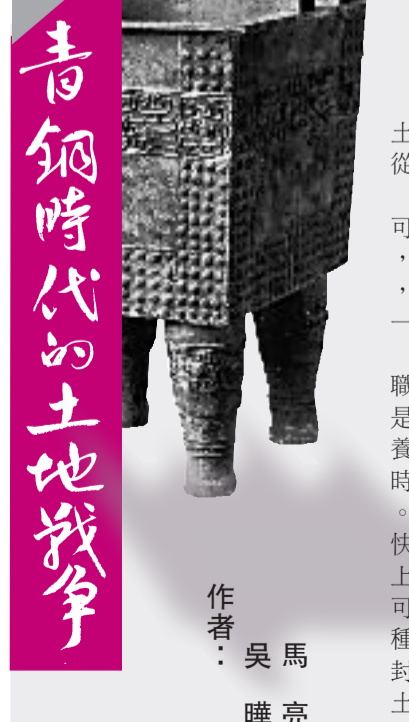
青銅時代的土地戰爭