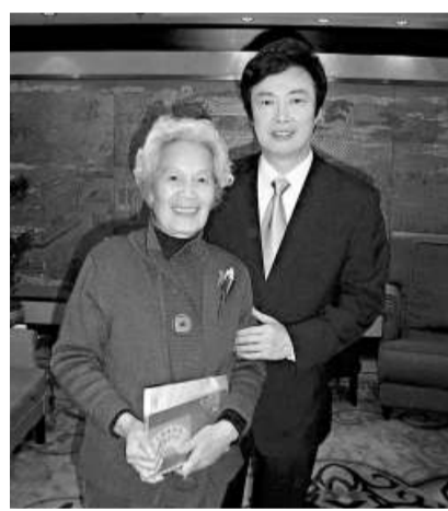
西安梁老太十餘年追星，終得與偶像合影

【本報記者寇偉、通訊員呂雷西安四日電】台灣歌星費玉清日前現身西安，引起了西安歌迷的瘋狂追捧。一位年過七旬的老人在現場衝破衆人和保安的阻攔，將一副自己親手書寫的字畫送給了費玉清，更是激動得幾欲落淚。 有「小哥」愛稱的費玉清此次是參加西安一家地產公司項目慶典活動，當晚共演唱了包括《夜來香》、《在水一方》、《千里之外》等在內的五首歌曲，每首歌都引起歌迷的陣陣尖叫和掌聲。 在第一首歌曲《夜來香》演唱中