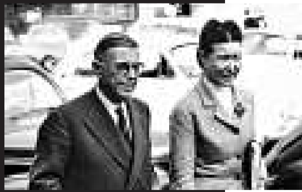
薩特與波伏瓦（資料圖片）