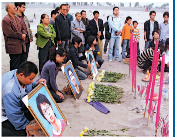
十月三十一日，長江大學生師生在長江邊祭奠三位英雄同學（新華社）