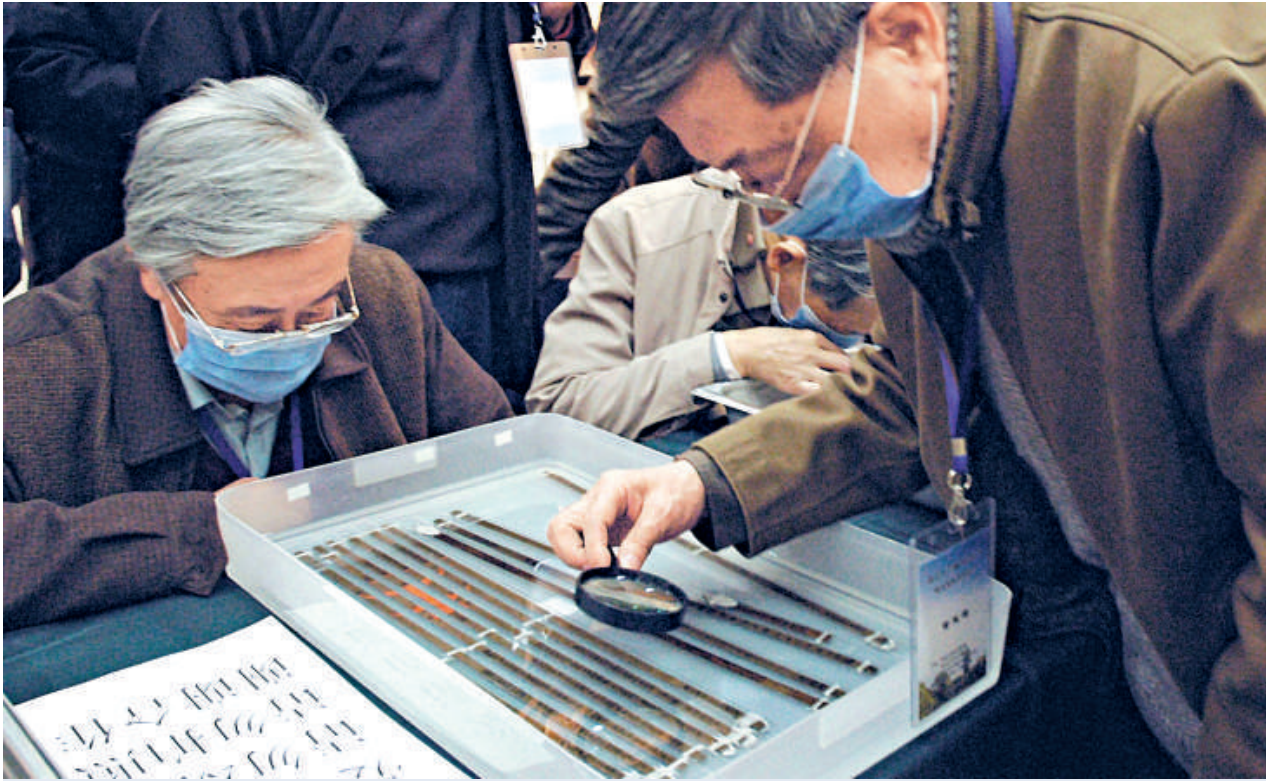
5日，一批專家在查看北大收藏的珍貴西漢竹書。為防止說話唾液對竹書造成傷害，專家們觀看時都戴上了口罩

竹書中還有秦朝丞相李斯編著的文字學著作《倉頡篇》。此書自宋代以後已經亡佚，上世紀20年代以來出土的漢代簡牘中對此有所發現，但大都只是保存了一些零星的片段。這次發現的竹書《倉頡篇》，保存了1200多個完整的文字，其中大多數為首次發現，對於漢字發展史的研究是極為寶貴的資料。