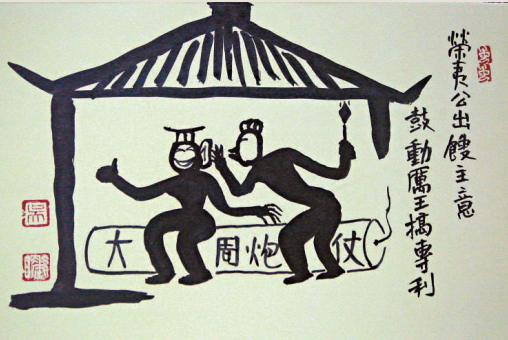
榮夷公鼓勵厲王搞專利（吳曉繪）

以及周天子統領國土資源的王畿內，再沒有人敢反對周王搞「專利」了，周厲王再也聽不到批評政府的聲音，他美滋滋地說：「怎麼樣，我終於使怨恨和誹謗停止了！」