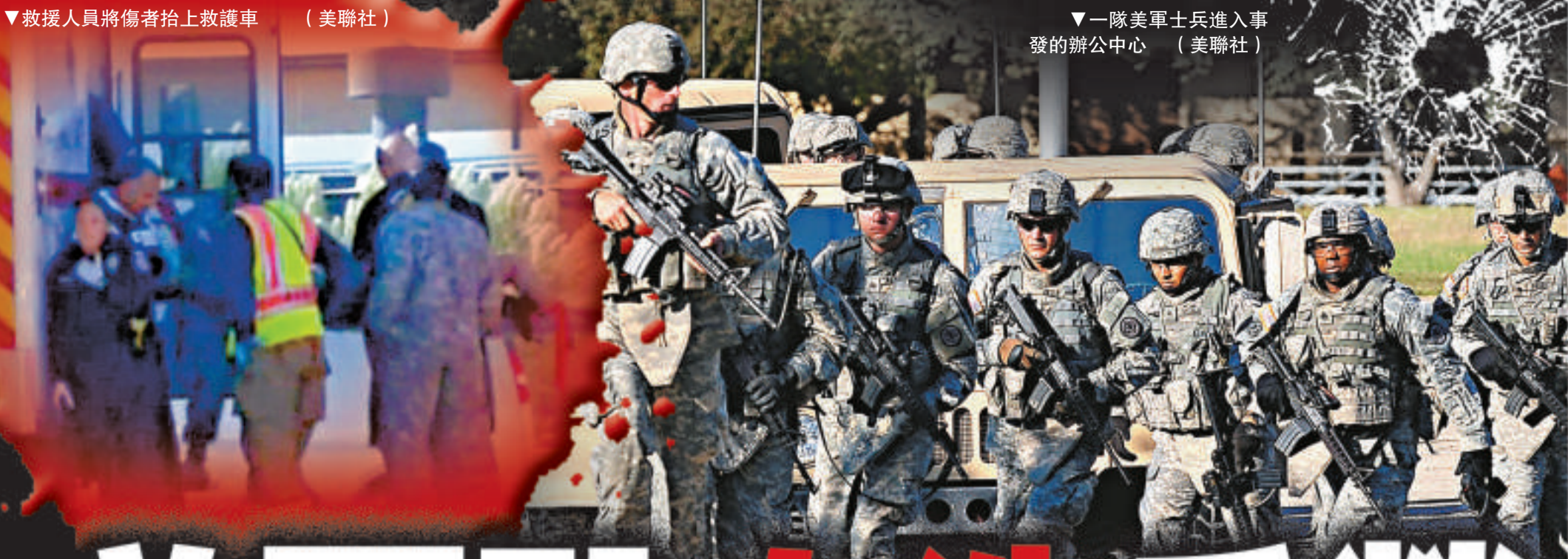
▼一隊美軍士兵進入事發的辦公中心