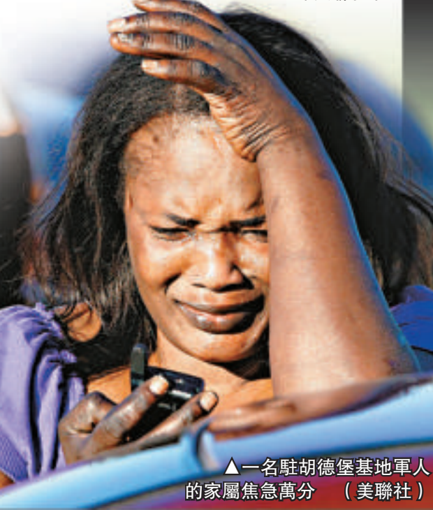
▲一名駐胡德堡基地軍人的家屬焦急萬分