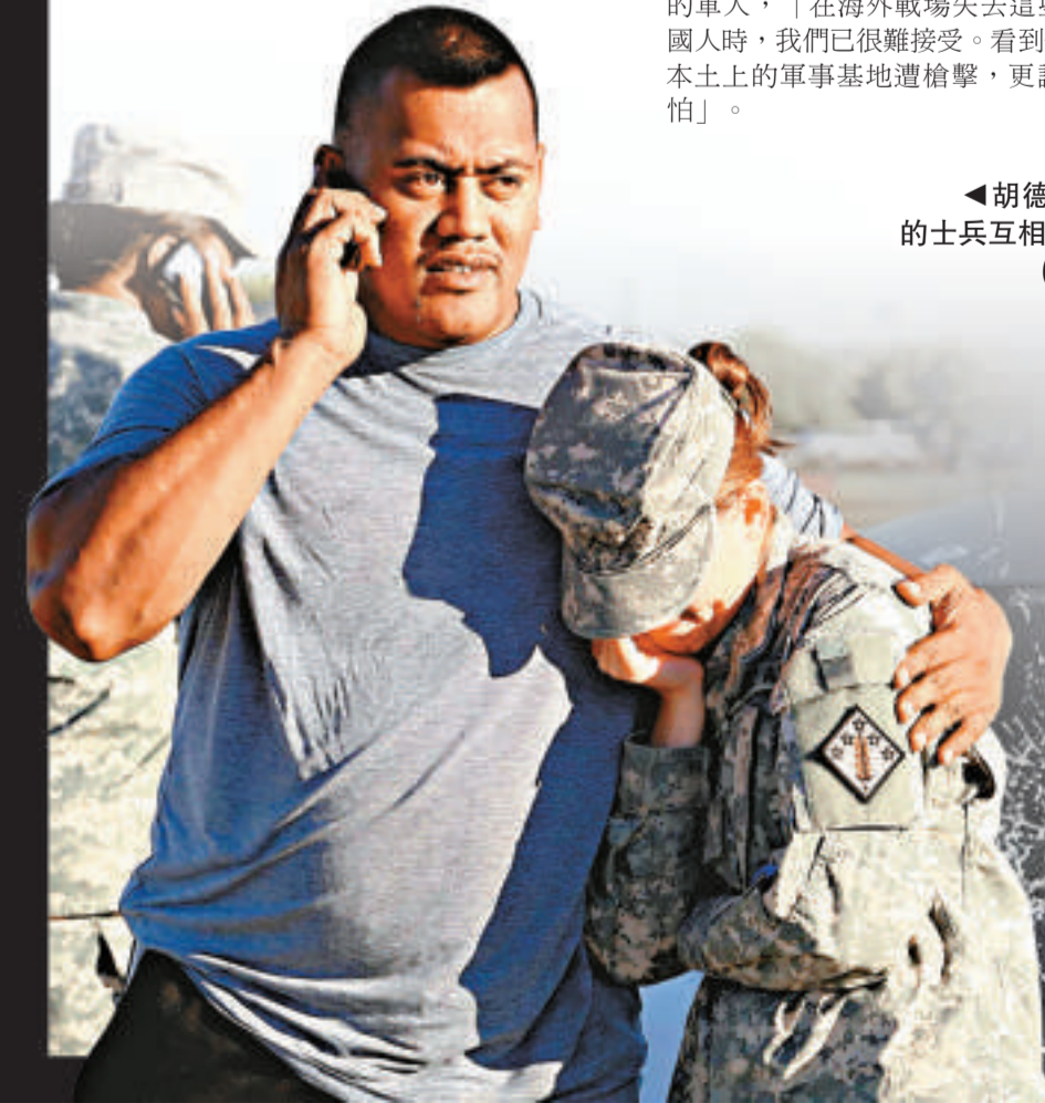
▼胡德堡基地內的士兵互相安慰

美國總統奧巴馬對這一重大槍擊案表示震驚，稱這起事件是「可怕的暴力大爆發」，聯邦政府將確保該基地及其人員的安全。他說，這起事件的受害者都是保衛國家安全的軍人，「在海外戰場失去這些勇敢的美國人時，我們已很難接受。看到他們在美國本土上的軍事基地遭槍擊，更讓人感到可怕」。