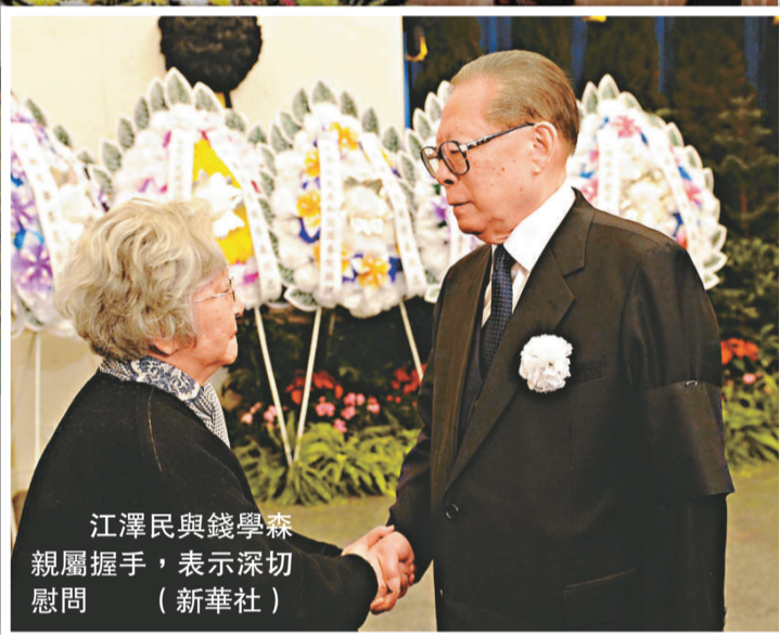
江澤民與錢學森親屬握手，表示深切慰問