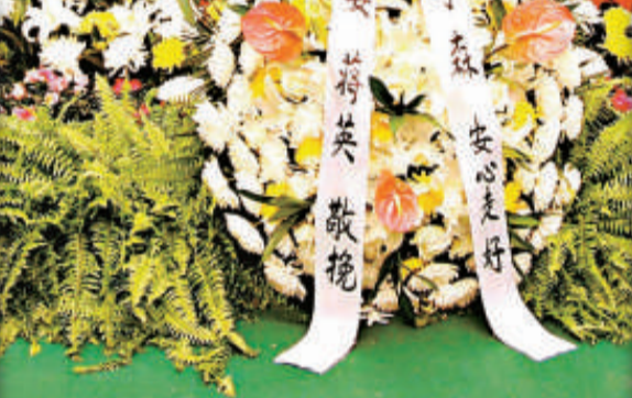
六日上午，錢學森遺體告別儀式在北京八寶山革命公墓舉行。胡錦濤、江澤民、吳邦國、溫家寶、賈慶林、李長春、習近平、李克強、賀國強、周永康、朱鎔基等罕有地集體前往送別。【本報記者 張靖唯、賈磊六日電】