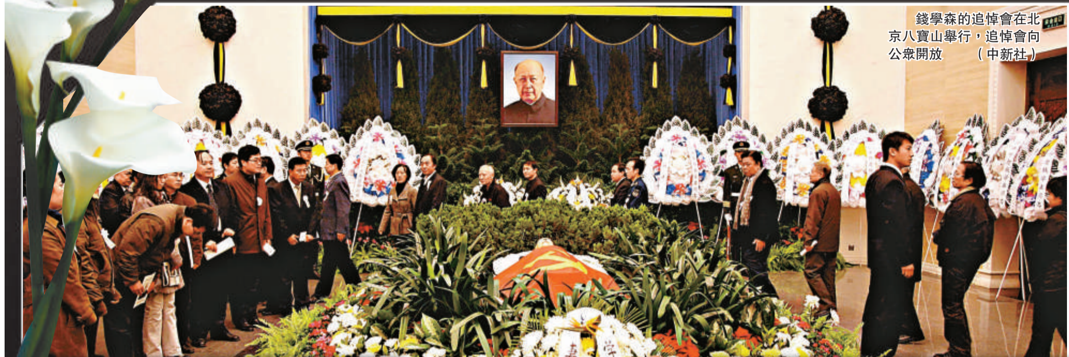
錢學森的追悼會在北京八寶山舉行，追悼會向公眾開放