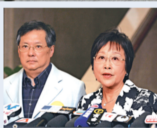
▲ 自由黨議員