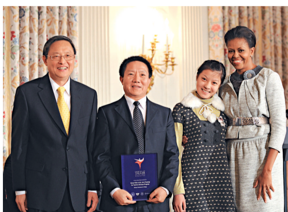
美國總統人文藝術委員會名譽主席、奧巴馬總統夫人米歇爾（右一）近日在白宮舉行每年一度的美國總統人文藝術「站得更高獎」頒獎儀式。來自中國四川成都市的四川職業藝術學院因一項助員社會幫助貧困學生實現藝術人生的項目獲得此項殊榮。圖為中國駐美大使周文重（左一）與四川職業藝術學院副院長蔡偉（左二）和該校學生、「小梅花獎」得主林雨佳在接受獎牌之後與米歇爾合影。

根據協議，該項目總佔地五千畝，自二〇一〇年三月至二〇一四年三月，分兩期建設。基地建成後將主要生產無人機、無人車、船載/車載天線等高科技產品。