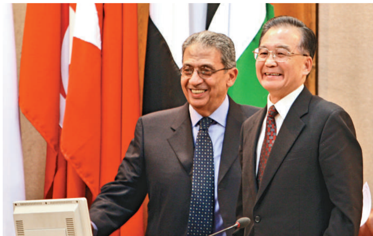
中國總理溫家寶七日在開羅阿拉伯國家聯盟總部發表題為《尊重文明的多樣性》的重要演講。這是溫家寶與阿盟秘書長穆薩在主席台上

當天，溫家寶還視察了開羅中國文化中心，向獲得「文化交流貢獻獎」的埃及知名人士頒獎，並觀看了埃及青少年用中文表演的節目。現場歡聲笑語，掌聲不斷。