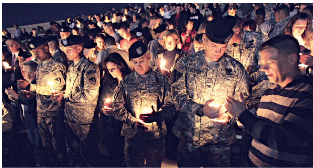
軍人在胡德堡基地為死者舉行追思會