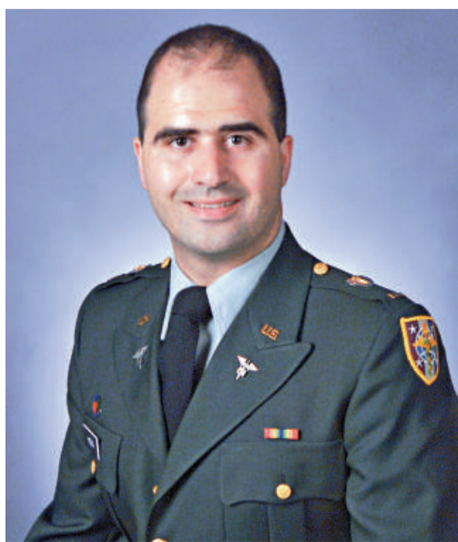
胡德堡基地槍擊案疑兇哈桑的大學畢業照

【本報訊】綜合美國媒體七日報道：美軍胡德堡陸軍基地發生的槍擊案目前已造成13人死亡、30人受傷。槍擊案兇手納達爾-馬利克-哈桑少校的表兄稱，哈桑並不是一名恐怖分子，他做出這種瘋狂舉動很可能是因爲心理受到了嚴重的創傷。