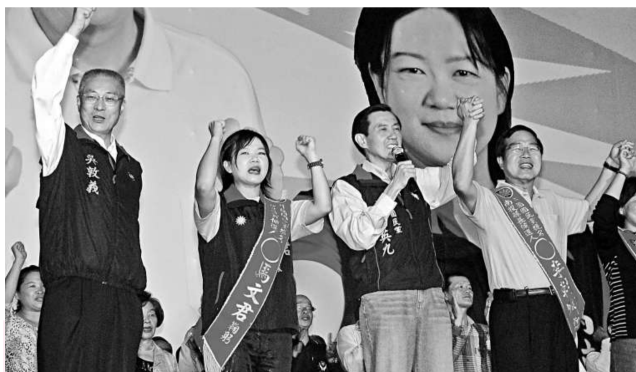
馬英九（右二）、吳敦義（右四）昨日同台出席國民黨籍南投縣長參選人李朝卿（右一）競選總部成立站台打氣

他強調，政府將要求各有關部會，一方面用修法方式授權衛生機關把上述把關措施都納入查驗過程外，也要再多跟民衆溝通，「基本上這是安全的」。