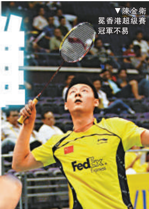
▼陳金衛冕香港超級賽冠軍不易