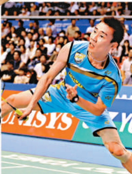
▲馬來西亞名將李宗偉爭取首次在港摘元