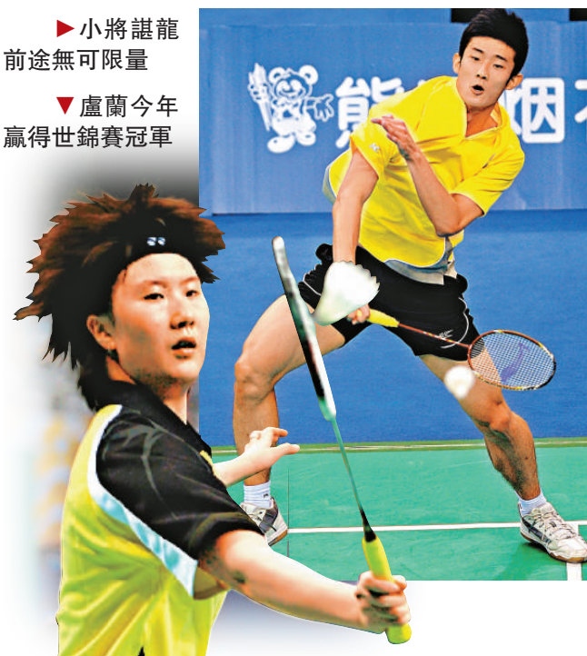
►小將龍龍前途無可限量

女隊方面，老將張寧、謝杏芳剛退下火線，一眾「小花」便急不及待接棒，王儀涵、王琳及王適嫻更已成為國家隊的主力。然而不少經驗豐富的「師姐」未有因此而淡出，蔣燕皎、盧蘭等實力、經驗俱在，盧蘭更在今年世錦賽擊敗過王琳，在良性競爭下，國家隊的實力肯定將進一步提升。