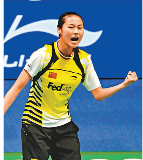
「世界一姐」王儀涵年紀輕輕已在比賽中甚有威勢