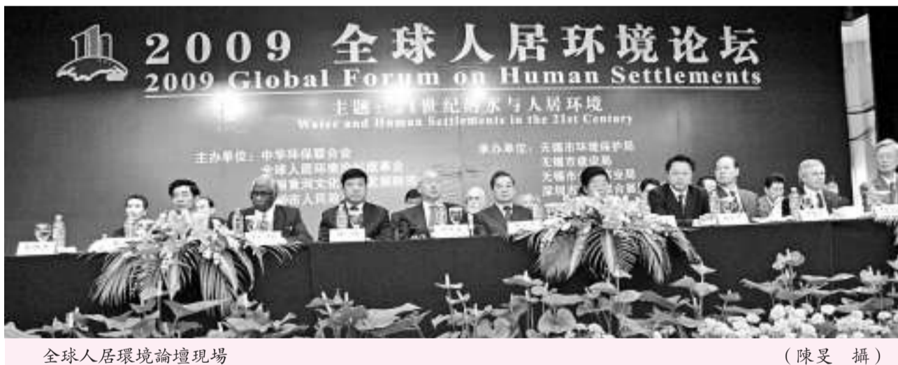
全球人居環境論壇現場

關於對強制清算申請的受理，《紀要》規定，申請人提供被申請人自行清算中故意拖延清算，或者存在其他違法清算可能嚴重損害債權人或者股東利益的相應證據材料後，被申請人未能舉出相反證據的，人民法院對申請人提出的強制清算申請應予受理。債權人申請強制清算，被申請人的主要財產、賬冊、重要文件等滅失，或者被申請人人員下落不明，導致無法清算的，人民法院不得以此為由不予受理。