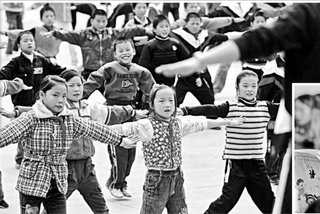
▼網民「期盼」之首的是「提高教師素質」 (資料圖片)