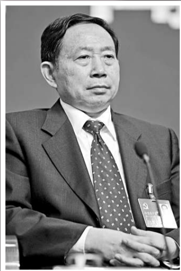
▲新任中國教育部長袁貴仁

中共中央政治局委員、國務委員劉延東出席該會議時強調，當前及今後一段時間，推進義務教育均衡發展要讓每一個適齡兒童少年平等享有接受義務教育的機會，全面提高普及水平；保障學生公平接受教育的權利，合理配置義務教育資源；發展高質量義務教育和學生健康成長，大力推進素質教育；學生都能享有條件良好的義務教育，不斷提高保障水平。