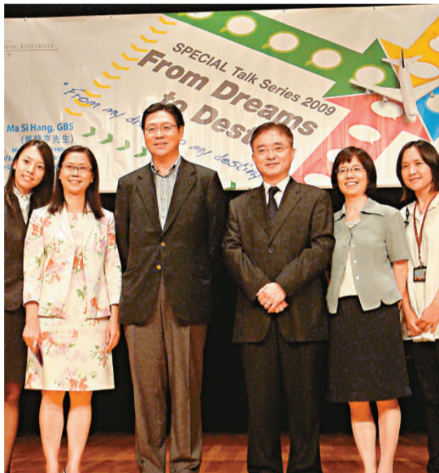
馬時亨（左三）說，每個青少年都應捫心自問自己的夢想是什麼，確定後應付諸實踐。

他表示，如今二十幾歲的青年會選擇去上海工作而非紐約，「港生去內地工作要端正心態，抱着先天下之憂而憂，後天下之樂而樂的心情。能在一個城市，特別是自己國家的發展之初便參與建設，是一件非常美妙也非常有成就感的事，許多年以後，你可以跟你的兒女說，這裡的建設我有參與，沒有什麼能比這更有成就感了。」現場有學生不放過黃金機會，向馬時亨索要投資貼士，引起全場爆笑。