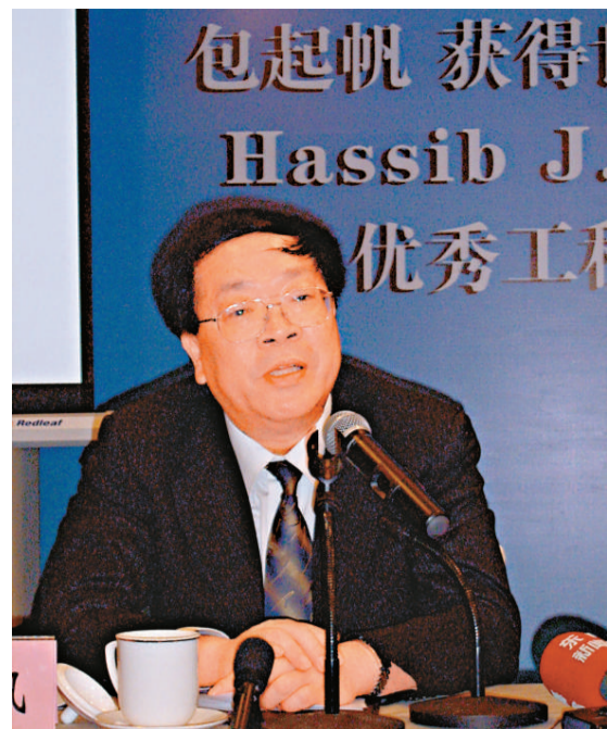
中國著名工程專家包起帆獲得「阿西布·薩巴格優秀工程建設獎」

此後的上世紀90年代，人們先後在佛坪保護區以及其附近的長青保護區發現三隻棕色大熊貓，但都在野外。科研人員目前並未完全掌握現存棕色大熊貓的數量及狀況。