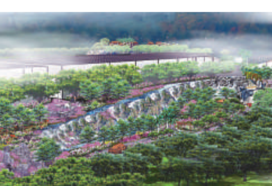
蘭花世界幽蘭流芳景區效果圖

公園是按照國家5A級旅遊景區標準建造的，以蘭花文化、蘭花叢林和趣味蘭藝為主題，整體呈現了中國古典園林和東南亞景觀風格相結合的特色。整個景區規劃由樹生蘭花景觀遊覽區、岩生蘭花景觀遊覽區、地生蘭花景觀遊覽區、蘭花博覽中心景觀遊覽區、蘭花種植景觀遊覽區、蘭花文化長廊、野生蘭谷遊覽區和入口景觀區組成。