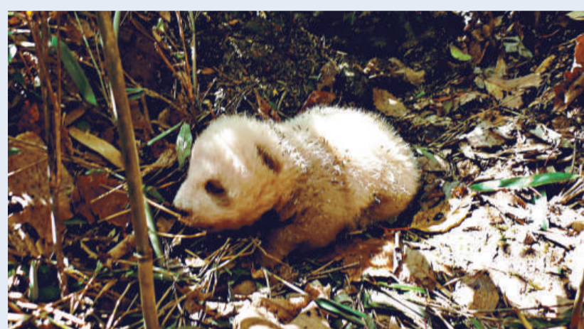
▲新發現於佛坪自然保護區的棕色大熊貓幼仔

►科學界首次發現的棕色大熊貓「丹丹」去世後，其皮毛製成的標本現存於佛坪縣自然保護區內