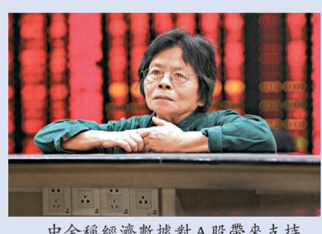
中金稱經濟數據對A股帶來支持

報告還指出，A股市場近期將體現為兩種風格特徵：一種就是大小盤風格轉換，第二種就是今年以來一直存在的A股市場的「月內宏觀數據效應」。歷史上A股大小盤風格轉換特徵明顯，完整輪換周期一般持續十個月到一年半。從去年十月份開始，市場進入上升趨勢，大小盤的風格也經歷了一次