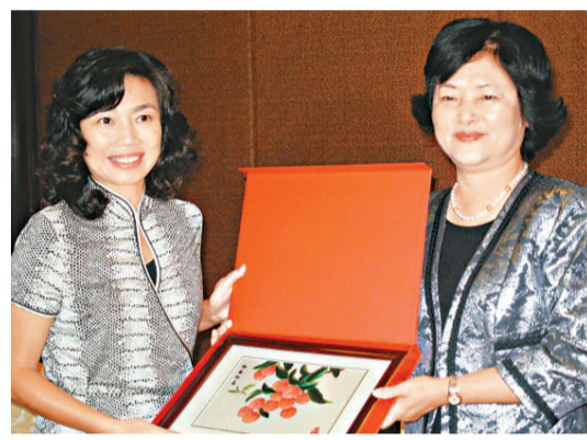
廣東省副省長雷于藍(右)向與會的香港民政事務局副秘書長甄美薇贈送禮品 (本報攝)

香港文化中心二十周年「琴琴聲賀生辰——四鋼琴音樂會」由康樂及文化事務署主辦，於十一月十二日（星期四）晚上八時，在香港文化中心音樂廳舉行，門票於城市電腦售票網發售，查詢可電二六八七三二一。