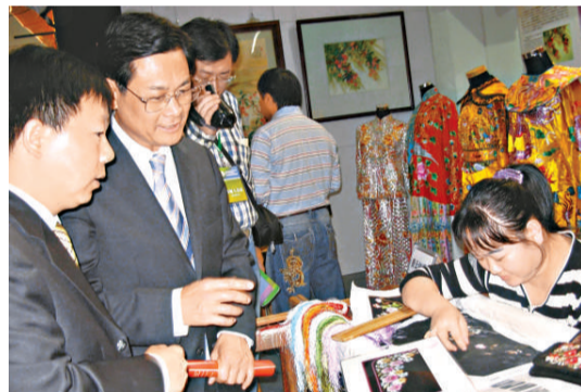
嘉賓參觀傳統技藝演示