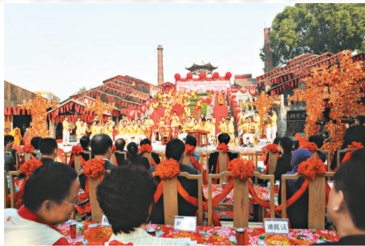
廣東省與東盟非物質文化遺產保護交流會現場 東盟文化官員參觀佛山南風古灶 (本報攝)

非物質文化遺產是各國、各區域、各民族人民世代相承的精神記憶，是與生活密切相關的文化結晶，是人類文化發展多樣性的生動見證，也是不可