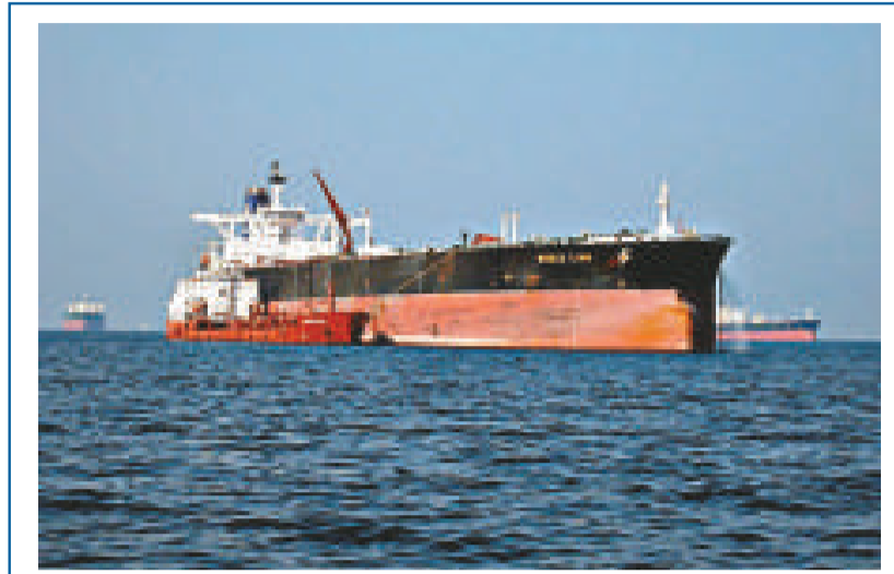
險遭索馬里海盜劫持的香港油輪「BW獅」號（資料圖片）