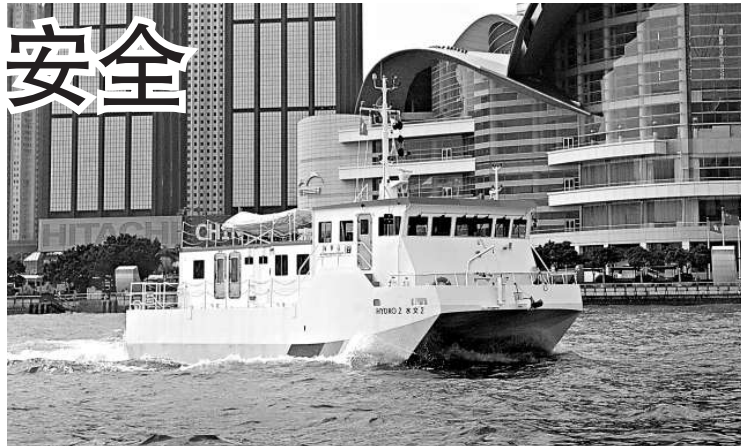
海事處先進的「水文 2 號」測量船

在 2003 年推出的香港電子海圖的改正資訊也是透過每 2 星期的《電子航海通告》發布。已訂閱的用戶可從互聯網下載有關改正。《2009 年香港水域本地船隻海圖冊》是海道測量部出版同類圖冊的第 2 版。這本圖冊厚 132 頁，比 A3 紙張面積略大的設計，是為方便航海者攜帶及查閱。有關改正是以「修正貼圖」形式發布，以便航海者修正圖冊。