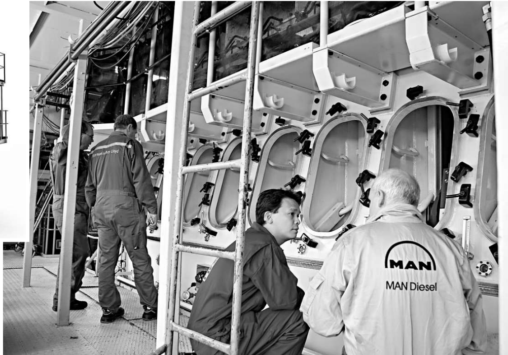
MAN Diesel 專為中國內河和沿海貿易船舶設計的 MC-C9 型二衝程發動機（左小圖）

另外，他透露，近期只有少數客戶要求撤單，但隨著不少船東和船廠就推遲新船交付的談判上達成共識，現時明顯有更多客戶期望推遲發動機的交付日期。他預料，連計未落實的訂單在內，新發動機訂單撤單量最高可達 6000 台。