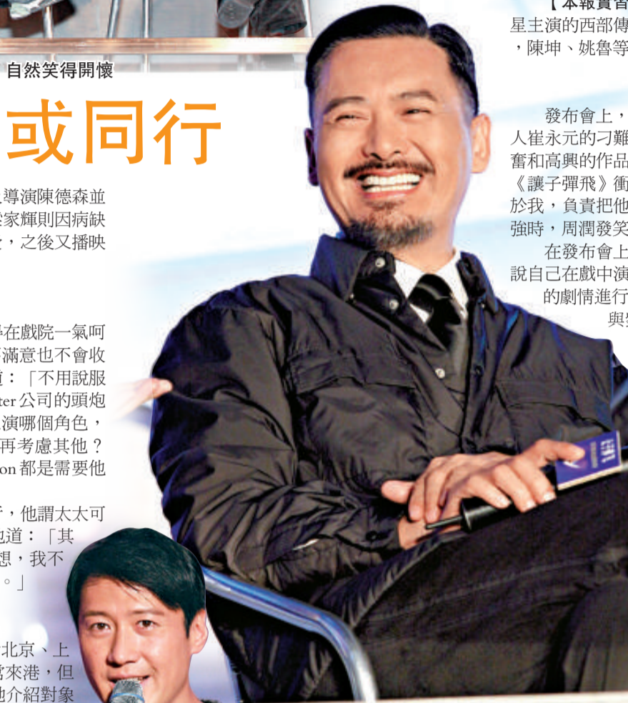
發哥直言收了支票,連劇本沒看便決定接拍了