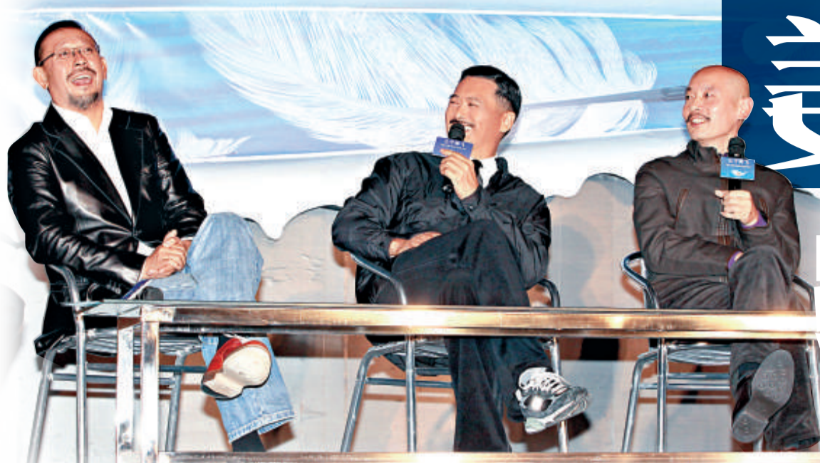
姜文(左)成功拉攏兩位影帝合作,自然笑得開懷

【本報實習記者李銳北京十日電】由姜文導演,周潤發、葛優、劉嘉玲、姜文、陳坤等內地頂級影星主演的西部傳奇大片《讓子彈飛》今日在京舉行首次新聞發布會。姜文、周潤發、葛優三大影帝攜手,陳坤、姚魯等主要演員集體亮相。