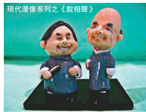
現代漫像系列之《說相聲》