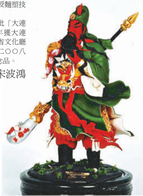
▼麵塑作品《武聖關羽》