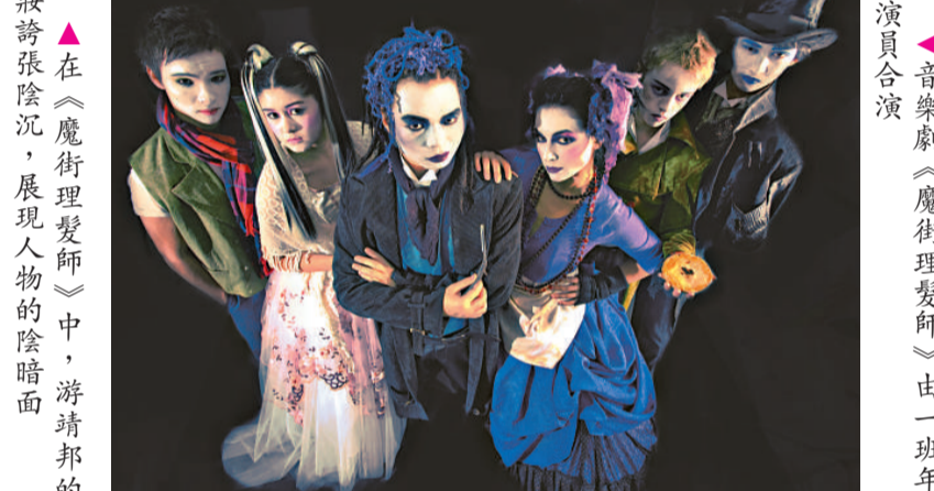
音樂劇《魔街理髮師》由一班年輕演員合演