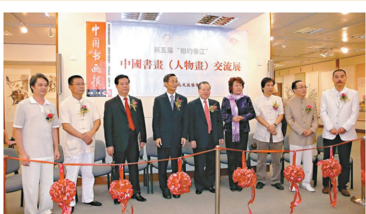
▲眾嘉賓主持剪綵儀式