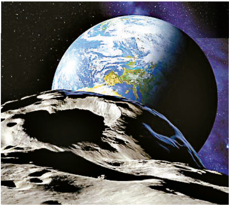
▲一顆隕石上周五差點撞向地球，科學家竟茫然不知

馬莎一名發言人說：「我們注意到，碧咸式的時髦內褲，購買者主要是女人而非男人。」另外，馬莎網站上所有有關男內褲的評論，都是由女顧客寫的。（綜合報道）