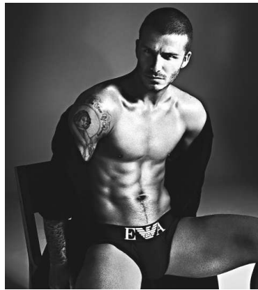
▲碧咸的內褲廣告，對象顧客其實是女性

英國德班漢氏百貨公司一項購物人士調查顯示，在童年至少年時期，男人都依賴母親為他們買內褲。