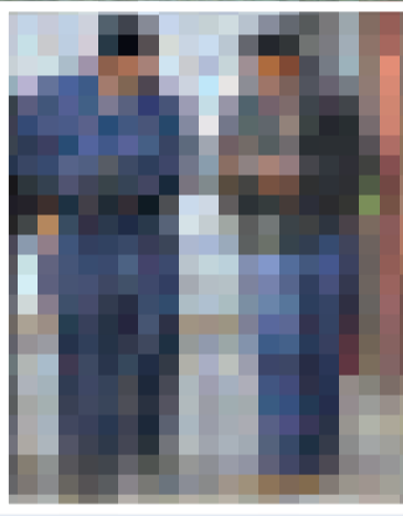
調查人員在案發現場附近進行大規模搜索及發掘行動

總教堂位於密蘇里州獨立村的基督社區，現時在世界各地擁有共二十五萬名信眾。此教會於一八六〇年自耶穌基督後期聖徒教會分裂出來，初時名為重組後的耶穌基督後期聖徒教會，在二〇〇一年才改作現時的名字。