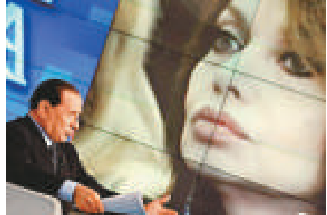
意大利總理貝盧斯科尼的妻子拉里奧 (右) 索要離婚贍養費 (資料圖片)

【本報訊】據中通社十二日電：早前深陷性醜聞的意大利總理貝盧斯科尼，儘管出書自清絕無緋聞，但他的妻子拉里奧還是向法院遞出了離婚請求，並向貝盧斯科尼索取贍養費。