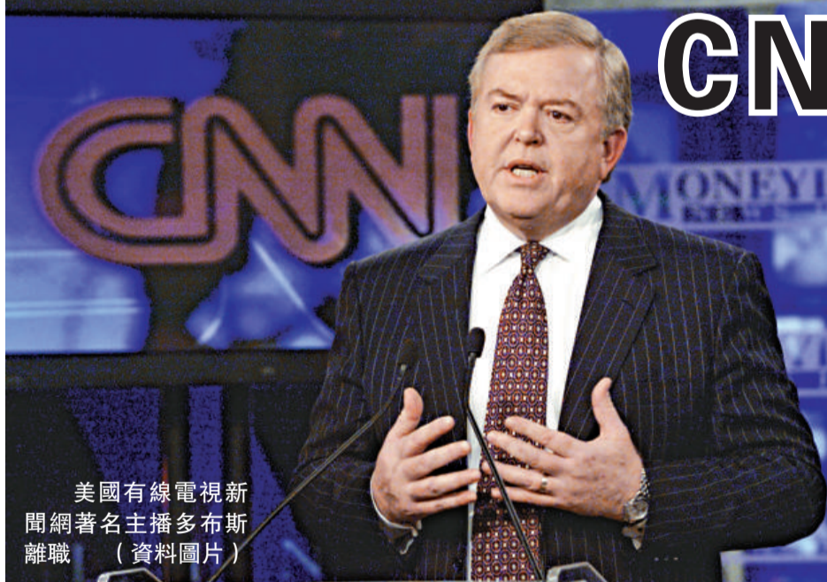
美國有線電視新聞網著名主播多布斯離職 (資料圖片)

【本報訊】綜合通訊社十二日報導：因反移民立場備受外界爭議的美國有線電視新聞網（CNN）著名主播多布斯（Lou Dobbs），週三晚突然在晚間新聞及時事評論節目中宣布離職，即時生效。他解釋離職是要尋求更大的表達意見空間，因此已和公司提前解約。多布斯的反移民立場一直受到民權及拉美組織猛烈抨擊，他們多番要求 CNN 解僱多布斯，因為他散播仇恨言論。