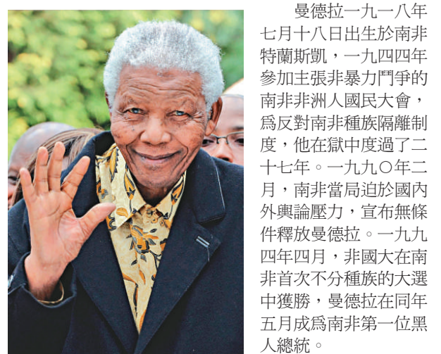
曼德拉一九一八年七月十八日出生於南非特蘭斯凱，一九四四年參加主張非暴力鬥爭的南非非洲人國民大會，為反對南非種族隔離制度，他在獄中度過了二十七年。一九九〇年二月，南非當局迫於國內外輿論壓力，宣布無條件釋放曼德拉。一九九四年四月，非國大在南非首次不分種族的大選中獲勝，曼德拉在同年五月成為南非第一位黑人總統。

潘基文秘書長在今年七月十八日發表的致詞中曾指出，曼德拉是聯合國最高價值的鮮活體現，他滿懷決心地致力於實現民主、多種族共存的南非，他堅定不移地追求正義，他甘願與迫害他最嚴重的人們和解，直至今日，他仍然在為世界和平和人類尊嚴而不懈努力，他是世界公民的典範。