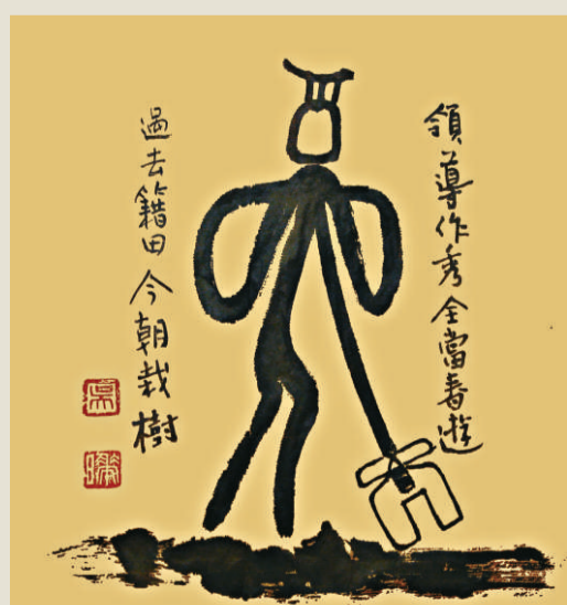
周宣王籍田圖（吳嘩 繪）

表面看，這個報告寫的洋洋灑灑，觀點分明，論據充分，可實際上裡面卻有許多貓膩——周朝統治的特點，是天子、諸侯和卿大夫各有其土、各治其民。而在當時，只有自由民才有資格錄入戶口管理的版籍，人數占多數的奴隸，卻只是奴隸主的財產而已，根本無權被錄入。這些奴隸往往有名無姓，成為黑戶口，許多奴隸主