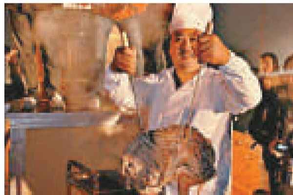
廚師從百年老鍋中取出美味羊肉

伴隨著「請我吃上席，不如掏羊鍋。羊翻沾老酒，強盜來了也不走……」的童謠，一場饕餮盛宴11日在浙江餘杭倉前鎮傾情上演——太炎故里，第四屆倉前羊鍋節隆重「開鍋」。