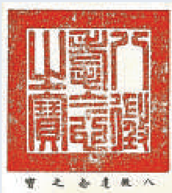
「八徵耄念之寶」放大精密對比可發現差異多達十多處

印痕跡很重，似乎是歷經了200年的無數次鈴蓋後留下的朱跡，而恰恰因為這點露出了仿製的馬腳。從現存大量玉璽可知乾隆用印是福州貢奉的「八寶印泥」，每次用璽後必清洗乾淨，每年要封存數日，陳設於交泰殿香案，高香水果供奉，大臣們跪拜敬香。正品皇家玉璽印面的朱跡似有似無，乾淨整潔，而印泥的色澤也並非如此此次拍賣的「八徵耄念之寶」滯呆而輕浮，原印印漬老成而鮮活。