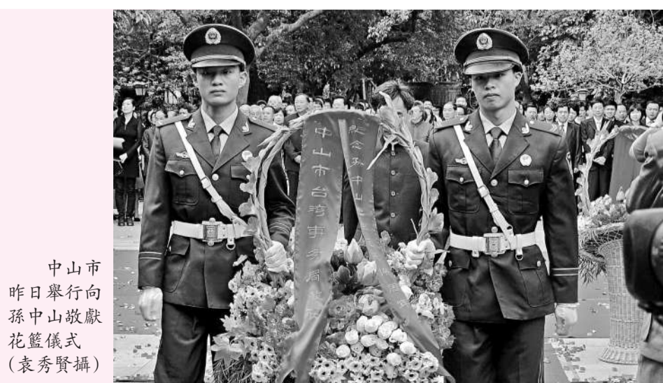
中山市昨日舉行向孫中山敬獻花籃儀式