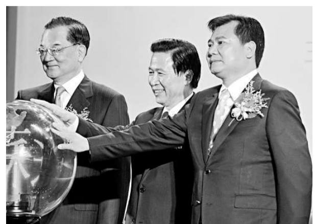
中共江蘇省委書記梁保華(中)、中國國民黨榮譽主席連戰(左)、蘇寧集團董事長張近東共同參加「台灣江蘇周」開幕式。

張近東說，集團願意和台資兄弟企業一起，精心培育內需市場，大力拓展國際市場；擴大投資規模，增進社會就業；提高員工收入，增加個人消費；提升規模效益，降低產品價格，從而提高社會的相對購買能力，以此來優化企業生存的市場生態環境。