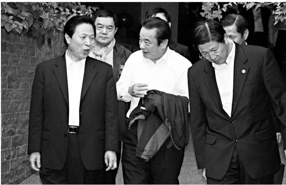
江蘇省委書記梁保華(左)昨日抵日月潭涵碧樓飯店，在前往碼頭搭船遊湖前，梁保華與台灣工業總會理事長陳武雄(中)等人拿掉領帶，準備輕鬆遊湖。

，當天下午在圓山飯店舉辦一場經貿採購洽談會，台灣二百多家廠商和四十九家大陸廠商進行面對面洽談。江蘇團此行將與台灣有關單位和廠商簽署包括十五個採購案在內的二十八項合作備忘錄，採購金額預計超過三十億美元。