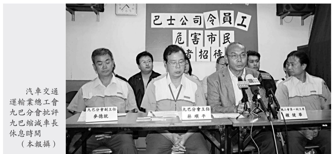
汽車交通運輸業總工會九巴分會批評九巴縮減車長休息時間

【本報訊】將軍澳九巴翻側嚴重車禍後，令社會關注巴士車長的編更制度。汽車交通運輸業總工會九巴分會指出，九巴近年在編更、工時等方面都不斷壓迫車長，令車長沒有足夠的休息時間，導致車長承受巨大的工作壓力，增加意外的風險，批評九巴等同逼車長「謀殺市民」。九巴回應表示，車長的編更是符合運輸署的標準。