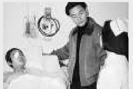
張國榮曾到聯合醫院探望末期癌症病人

另一位病人患上末期喉癌，不能言語。黃護士長知道她深愛金庸小說，冒昧地向金庸寫信，金庸亦受黃護士感動，寄來四套親筆簽名的小說和慰問信。連黃姑娘也獲贈一套《雪山飛狐》，叫病房上下都喜出望外！