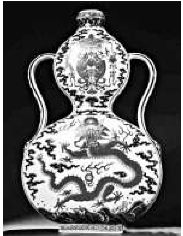
▲清乾隆青花海水紅彩龍紋如意耳葫蘆瓶拍出天價8344萬

【本報訊】北京翰海十五周年慶典拍賣會受到各界廣泛關注，海內外藏家競投踴躍，二十二個專場拍賣會總成交額達十點五五億元，其中，清乾隆年間的青花海水紅彩龍紋如意耳葫蘆瓶，以八千三百四十四萬元成交，創中國瓷器拍賣最高紀錄。