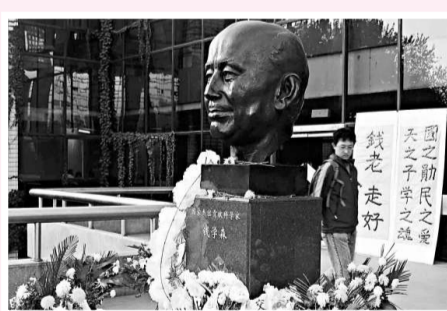
西安交通大學錢學森塑像

西安交通大學表示，設立「錢學森日」旨在推動交大師生繼承錢老精神遺產，運用錢老的「大成智慧學」和一系列重要思想主張，推進教育教學改革，加快創新步伐。