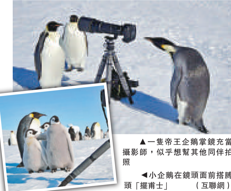
▲一隻帝王企鵝掌鏡充當攝影師，似乎想幫其他同伴拍照