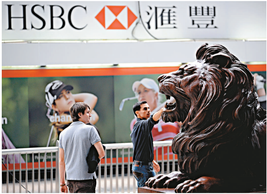
里昂將滙豐的投資評級由「沽售」上調至「跑輸大市」

下周一掛牌的中糧包裝，昨天暗盤開始便錄得近 20% 的升幅，隨後升幅繼續擴大。暗盤收報 7.09 元，較招股價 5.39 元升 31.54%。每手 1000 股，不計手續費，散戶每手賺 1700 元。中糧包裝一手中籤率爲 50%，申請 7 手才可穩獲 1 手。保薦人爲中銀國際及中金。