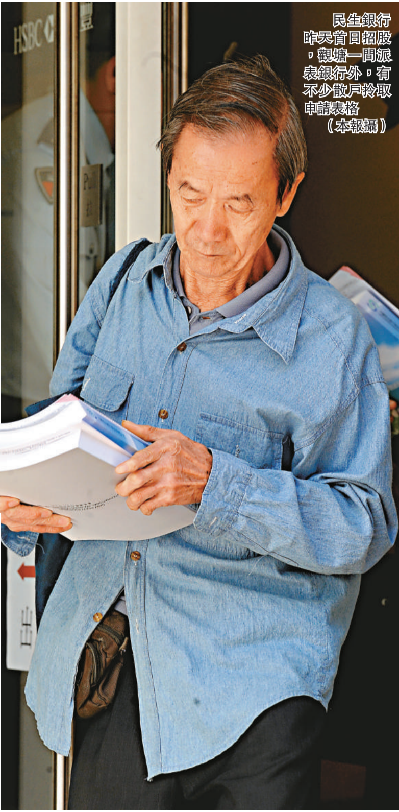
民生銀行昨日首日招股，觀塘一間派表銀行外，有不少散戶拾取申請表格

另外，有報引述消息指，加拿大上市公司克能石油(Tethys Petroleum)已向港交所(00388)遞交上市申請，預期明年首季來港作第二上市，集資額僅約 2 億元，保薦人爲華富。而據消息人士透露，全球最大水泥商拉法基及瑞安建築(00983)擬於明年分拆於中國的水泥合營來港進行招股上市，籌資最多 5 億至 6 億美元。