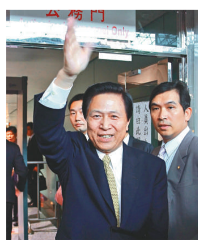
江蘇省委書記梁保華（前中）昨日離台，他以「很順利、很圓滿、很成功」描述此行成果，同時也提到，這次 70 家來台的江蘇企業，採購金額達 41.3 億美元

他也笑着說，這次行程很緊湊，沒有時間上街買東西送朋友，但卻感受到台灣人民很親切的一面。