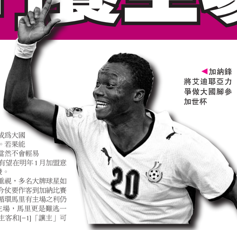
加納鋒將艾迪耶亞力爭做大國腳參加世杯

今場例行公事，馬里同樣並不重視，多名大牌球星如簡路迪及迪亞拉都未有入選，而且今仗要作客到加納比賽，舟車勞頓下球員的戰意成疑。首循環馬里有主場之利仍以0:2告負，今仗輪到加納坐鎮主場，馬里更是難逃一敗，可捧加納贏2球或以上，讓球主客和[-1]「讓主」可取。