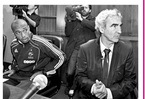
杜明尼治(右)坦言已慣了備受炮轟的日子

，否則我早已自殺。我無任何擔心，因為我是與24位隊員一起奮鬥。法國隊的利永遠在任何批評者之上。」杜明尼治沒有回應是否會爭取在首回合客賽愛爾蘭時取得作客入球，只說只要取得出線資格便可以。法國隊在首回合需要作客都柏林，然後次回合合於主場迎戰。