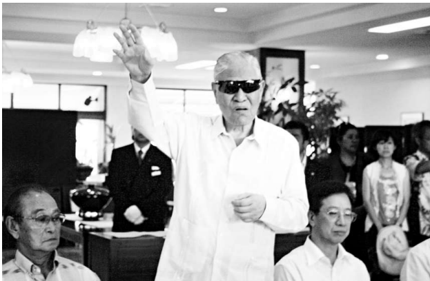
由陳水扁爆料的李登輝（站立者）洗錢案最近有新進展（資料圖片）

【本報訊】據台灣媒體十五日報道：台灣特偵組偵辦陳水扁告發李登輝洗錢案有新進展，決定將李登輝所牽涉的「奉天」、「當陽」機密專案、「鞏案」「國安」秘帳一併調查。基於統一偵查事權及釐清案情全貌，特偵組已要求台北地檢署將鞏案、台綜院買房舍、劉泰英涉及秘帳洗錢案等，全部移並特偵組擴大調查。