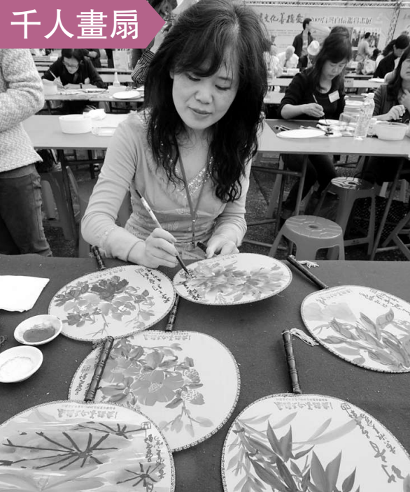
由台灣身心障礙者技藝協會主辦的「千人畫扇 萬人行善」活動十五日在台北舉行，來自台灣各地畫會的畫家、公益團體藝術家和藝術學校師生千餘人共同創作畫扇。這些畫扇作品將在日後展出和出售，所得收入作為籌建身心障礙者藝術中心的基金。

警方調查之後，將女童的周姓表姨傳喚到案，周女坦承有打小孩，加上死者的母親藏屍，兩人在偵訊之後被依法究辦。