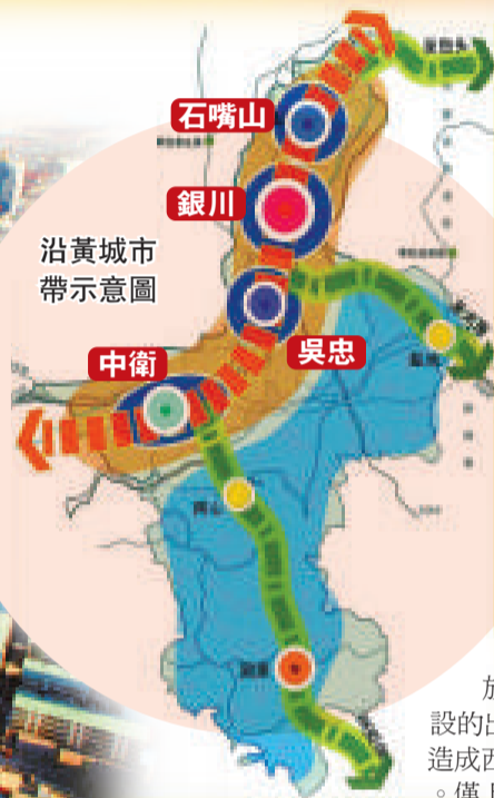
沿黃城市帶示意圖