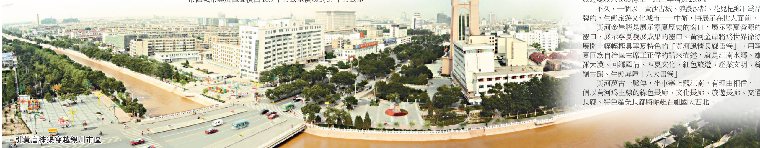
引黃唐徕渠穿過銀川市區

黃河萬古一脈傳，坐車塞上觀江南。有理由相信，一個以黃河為主線的綠色長廊、文化長廊、旅遊長廊、交通長廊、特色產業長廊將崛起在祖國大西北。