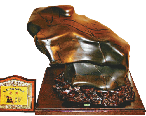
合山彩陶石——蛙兆豐年