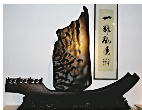
合山摩爾石——一帆風順

記者按圖索驥, 來到紅水河的上游, 恰巧有尋石者在河中打撈, 有幸目睹了尋石者潛水打撈的過程。打撈者告訴記者: 「好的石頭並不是那麼容易得到的, 有時候滿懷希望去打撈, 但會很失望地空手回來。也有不少村民撈到好石頭, 住上了青磚瓦房。但找石頭靠的是一緣分。與石頭有緣的人才能找到它。」看來, 好的石頭也如緣分般可遇不可求, 尋尋覓覓, 卻很可能一場空。或許正是因爲難得, 合山奇石才顯得珍貴無比。目前合山市內珍貴的奇石主要聚集在兩個地方: 一是合山奇石交易館; 二