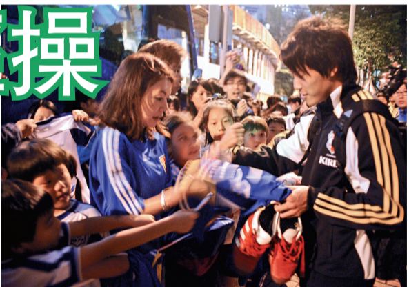
▲大批日籍小孩及他們的家長包圍掃桿埔遊樂場大門，向日本球員索取簽名

日本隊主教練岡田武史表示，明晚之戰是球隊難得齊集外流及本土球員的比賽，非常珍惜這個機會，考慮到這場是日本隊今年最後一場A級國際賽，加上明年初很難安排外流及本土球員一同訓練及比賽備戰世界杯決賽周，因此外流歐洲的球員中村俊輔、長谷部誠、本田圭佑、稻本潤一及松井大輔只要沒傷，明晚都會上陣。