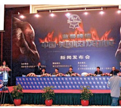
▲中美武術散打對抗賽新聞發布會現場

【本報記者呂劍廣州十六日電】由國家體育總局武術運動管理中心主辦的藍帶杯2009中美武術散打對抗賽，將於11月29日在廣州華南理工大學體育館舉行，今天在廣州召開新聞發布會上記者獲悉，經與美國武術協會商議決定，雙方各組選包括60公斤、70公斤、75公斤、80公斤、85公斤在內的5個級別選手參賽，以團體成績決定優勝。賽制為五場三勝制，每場比賽打滿三局，每局三分鐘。