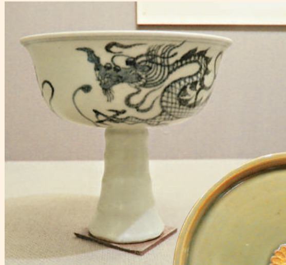
青花雲龍紋高足杯 龍泉青釉貼菊花紋碟