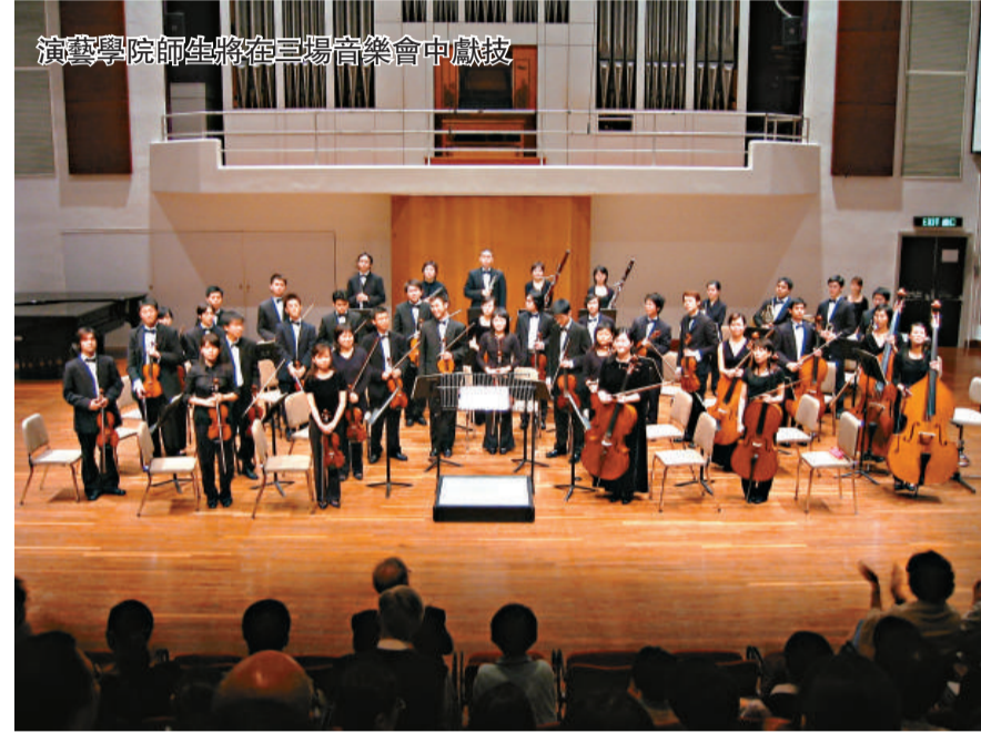
演藝學院師生將在三場音樂會中獻技