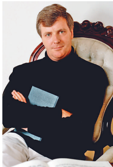
謝飛、蘭加士特將演奏九首海頓的奏鳴曲