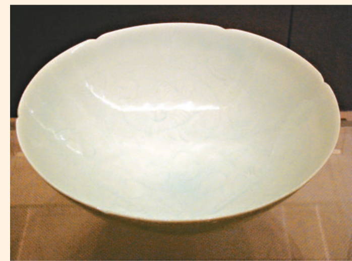
柴窯天青釉刻花碗 龍泉窯梅子青釉鬲式爐