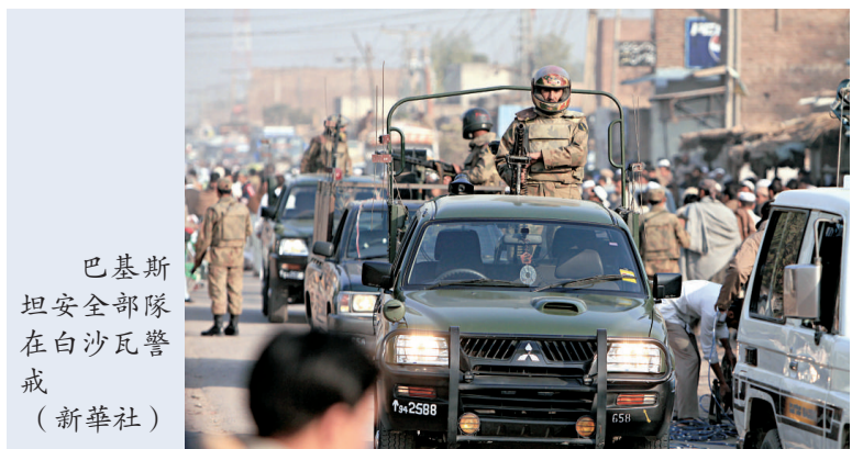
巴基斯坦安全部隊在白沙瓦警戒

這名官員說，二十多名受傷者被送往醫院接受救治，救援小組仍在廢墟中搜尋倖存者，傷亡人數可能進一步上升。目擊者說，六名兒童在爆炸中受傷，現場散落一些書包。