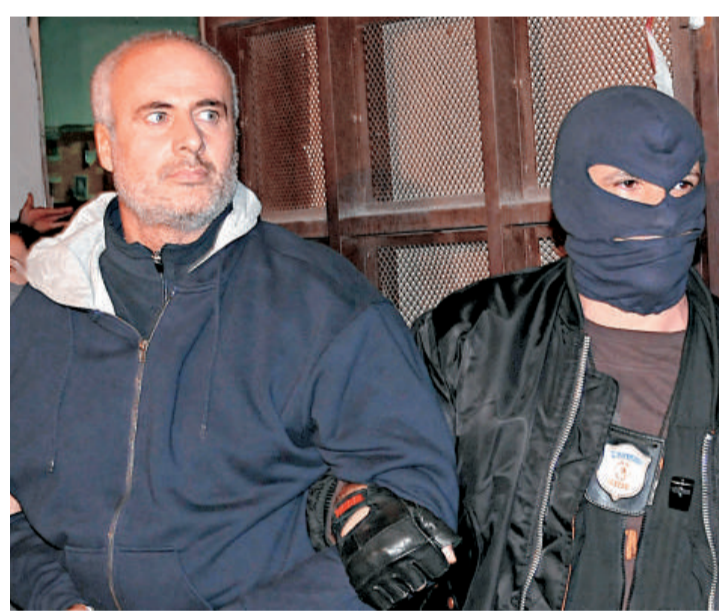
意大利黑手黨頭目拉庫利亞（左）被警方逮捕

去年年底，意大利警方對「我們的事業」發起「斬首行動」，目的在於破壞其組織新一輪的領導者選舉。當局說，已在過去一年半內逮捕三千六百多名黑手黨成員，包括三十名最危險通緝犯名單上的十五人。