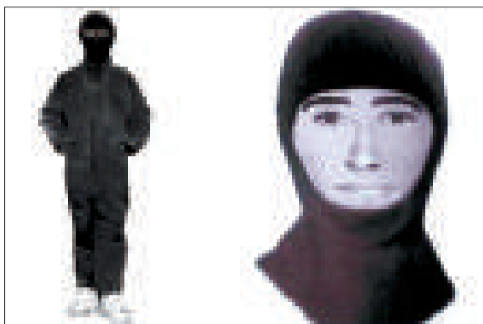
▲▼英國當局發布的「夜遊神」通緝照片