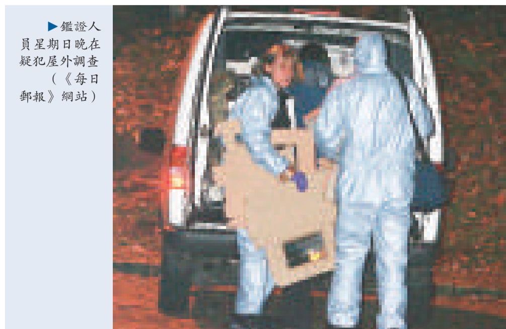
▶鑑證人員星期日晚在疑犯屋外調查（《每日郵報》網站）

由於疑犯清楚警方的調查方法，令人懷疑「夜遊神」是退役警員，因此調查隨後低調進行。經過多年抽絲剝繭式的調查，這名變態色魔終於落網。