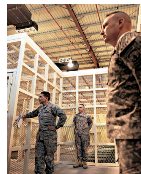
帕爾旺拘留所內部

巴格拉姆基地的舊拘留所於二〇〇一年底啟用，翌年底發生兩名囚犯相繼死亡的事件。軍方起初聲稱兩人死於自然原因，但其後揭露兩人死前曾被鎖上手銬毆打和刺穿睡眠。六名涉案美軍士兵二〇〇六年被判有罪，不過判罰輕微。